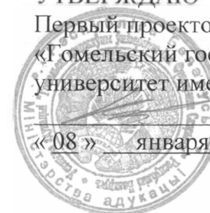
График проведения Дней охраны труда и осуществления контроля за соблюдением требований по охране труда структурных подразделений университета на 2025 год