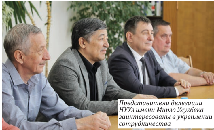
Представители делегации НУУЗ имени Мирзо Улугбека заинтересованы в укреплении сотрудничества

ГГУ продолжает укреплять международные связи, обмениваться опытом и расширять академическое сотрудничество между учреждениями. Особое внимание уделяется обсуждению результатов совместных исследований, перспектив реализации научных проектов.