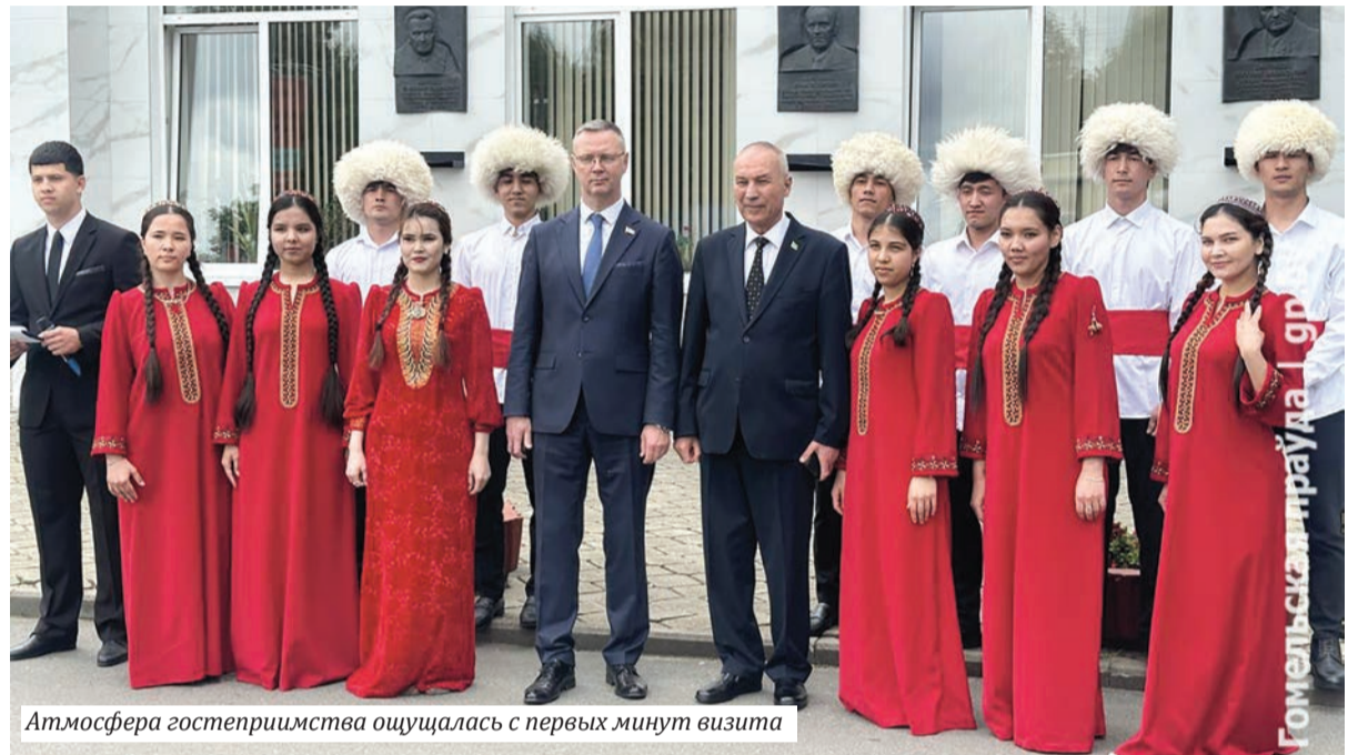
Атмосфера гостеприимства ощущалась с первых минут визита