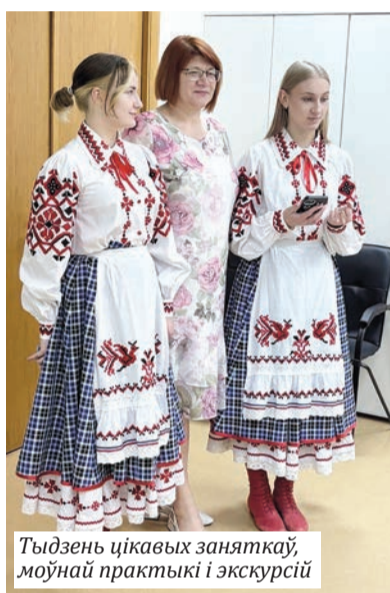
Тыдзень цікавых заняткаў, моўнай практыкі і экскурсій