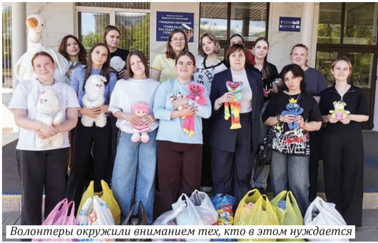
Волонтеры окружили вниманием тех, кто в этом нуждается

Как светились радостью лица самых маленьких пациентов, как радовались мамы малышей – это дорогого стоит. В