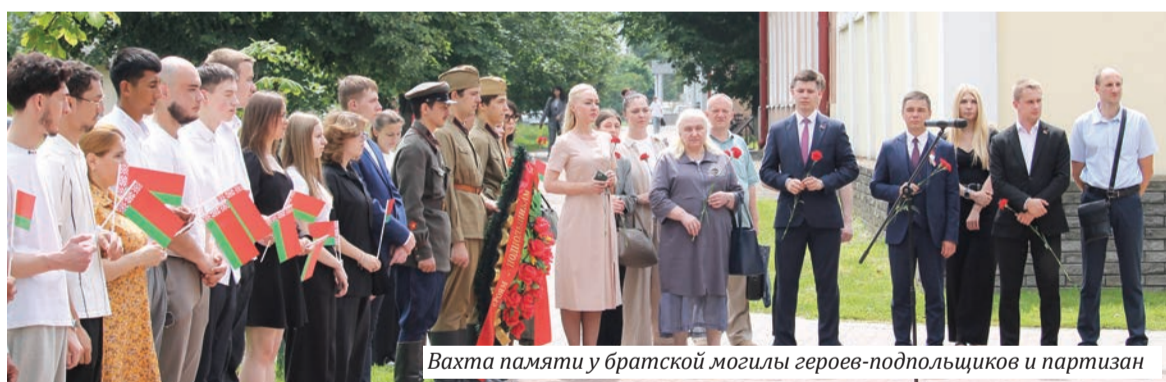
Вахта памяти у братской могилы героев-подпольщиков и партизан