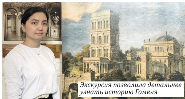
Экскурсия позволила детальнее узнать историю Гомеля