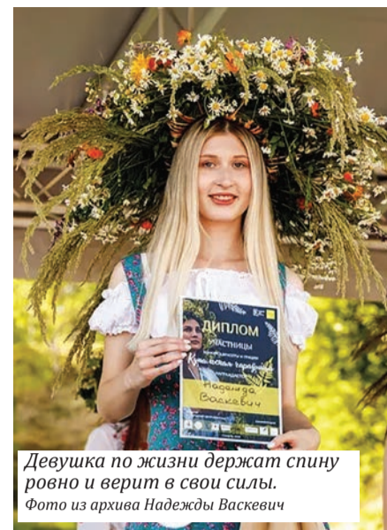
Девушка по жизни держит спину ровно и верит в свои силы.