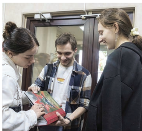
Студенты ознакомились с уникальной книгой «Гомель. Первый освобожденный»

Студенты филфака посетили редакцию газеты «Гомельская праўда». Это целый медиахолдинг, который, помимо газеты, включает интернет-ресурс, радио, издательский дом, видеопродакшн.