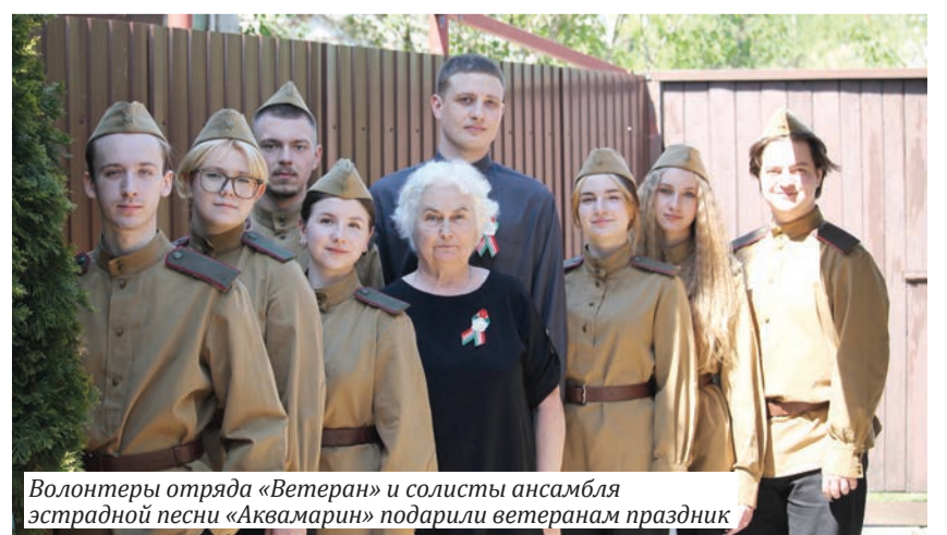
Волонтеры отряда «Ветеран» и солисты ансамбля эстрадной песни «Акварин» подарили ветеранам праздник