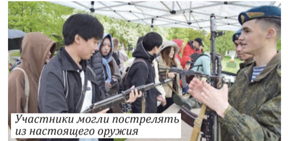
Участники могли пострелять из настоящего оружия