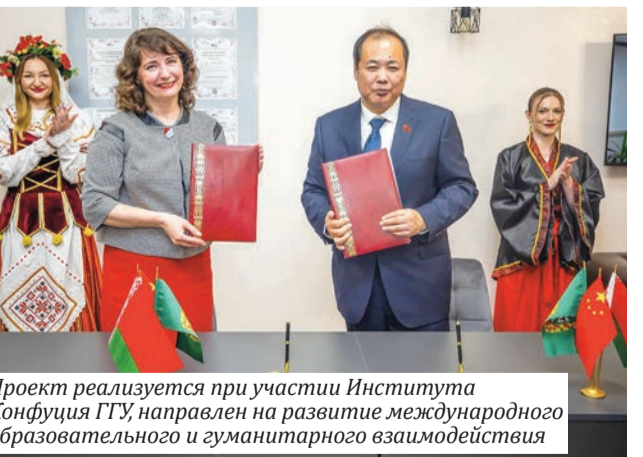
Проект реализуется при участии Института Конфуция ГГУ, направлен на развитие международного образовательного и гуманитарного взаимодействия

Соглашение предусматривает развитие сотрудничества в сфере традиционной китайской медицины, проведение совместных исследований, организацию стажировок и обмен опытом с