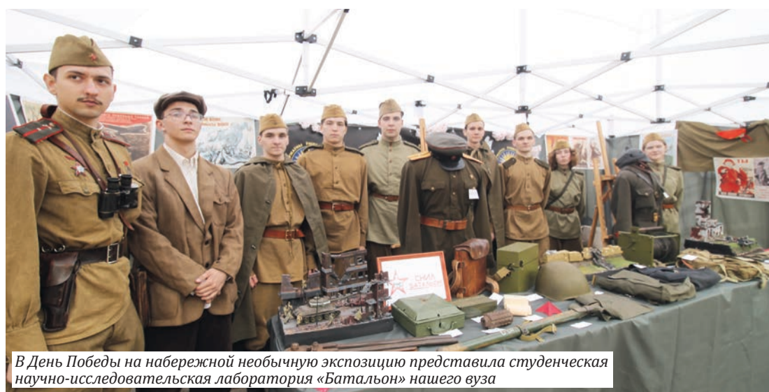
В День Победы на набережной необычную экспозицию представила студенческая научно-исследовательская лаборатория «Батальон» нашего вуза