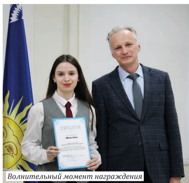
Волнительный момент награждения