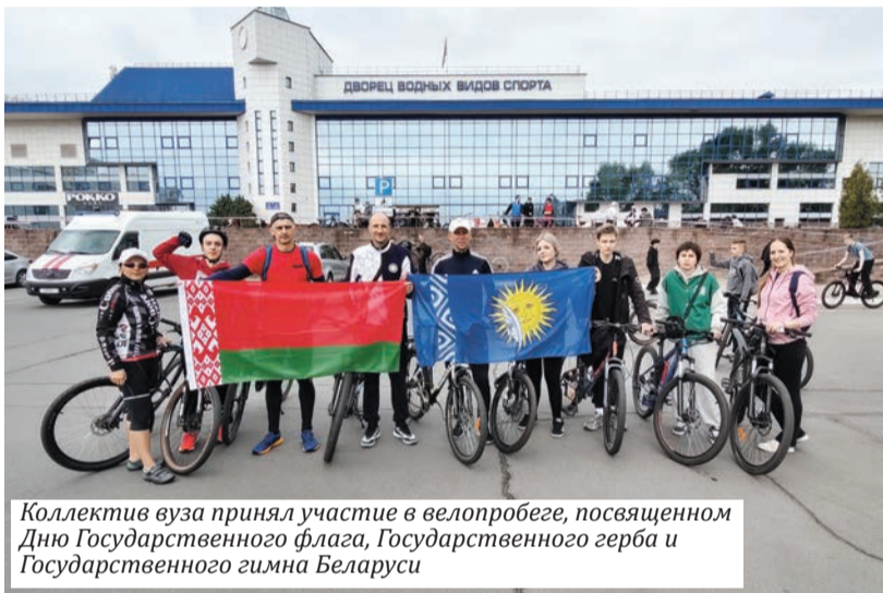
Коллектив вуза принял участие в велопробеге, посвященном Дню Государственного флага, Государственного герба и Государственного гимна Беларуси