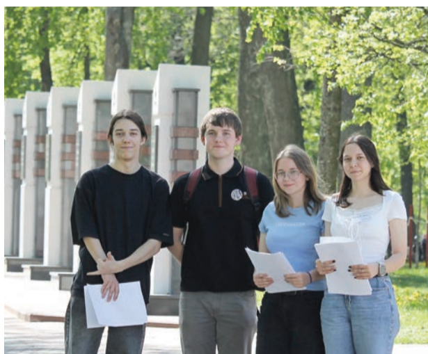
Интерактивный квест по мемориалам Гомеля посвятили истории Великой Отечественной войны

Кафедрой истории Беларуси совместно с Гомельским горкомом ОО «БРСМ» организован интерактивный квест для команд студентов вузов и колледжей по мемориалам, посвященным истории Великой Отечественной войны. В вы-