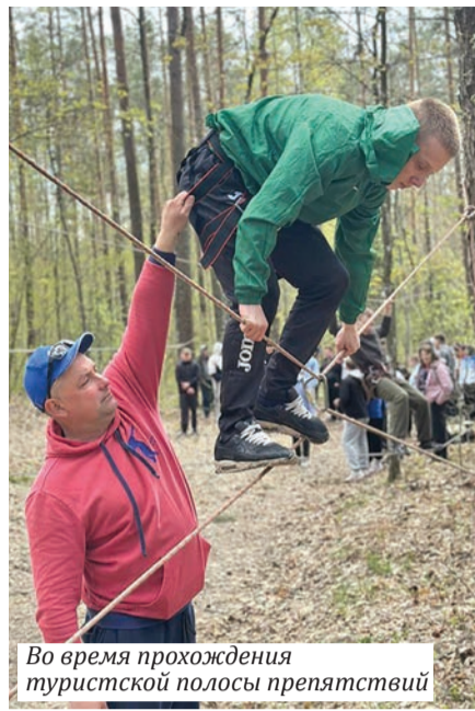
Во время прохождения туристской полосы препятствий

Подготовили и провели первенство по туризму преподаватели кафедры спортивных дисциплин. Пресс-центр ГГУ