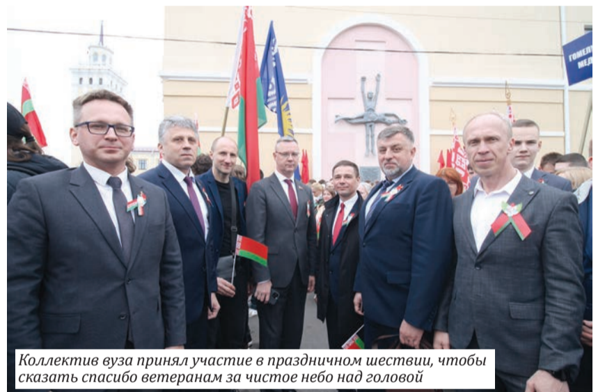
Коллектив вуза принял участие в праздничном шествии, чтобы сказать спасибо ветеранам за чистое небо над головой