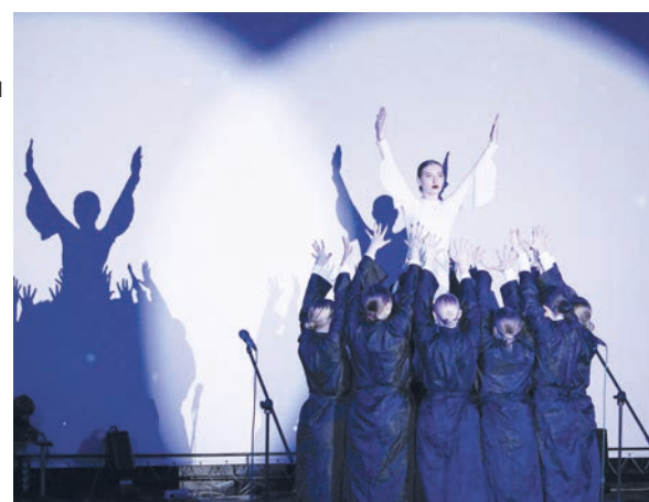
Зрителей порадовали искусством и талантами выпускники, творческие коллективы университета

ГГУ имени Ф. Скорины отметил 55 лет со дня преобразования Гомельского государственного пединститута имени В. П. Чкалова в Гомельский государственный университет. Финальным аккордом праздничных мероприятий стал концерт.