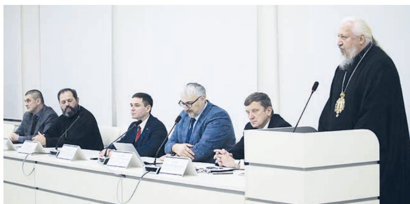
По результатам конференции при поддержке Гомельской епархии Белорусской православной церкви планируется издать сборник научных статей