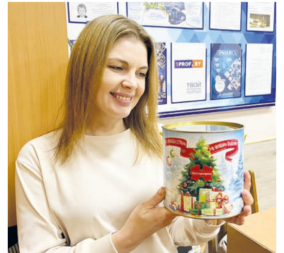
В рамках республиканской профсоюзной акции «Профсоюзы – детям!» первичная профорганизация ГГУ вручает сладкие новогодние подарки членам профсоюза, воспитывающим детей