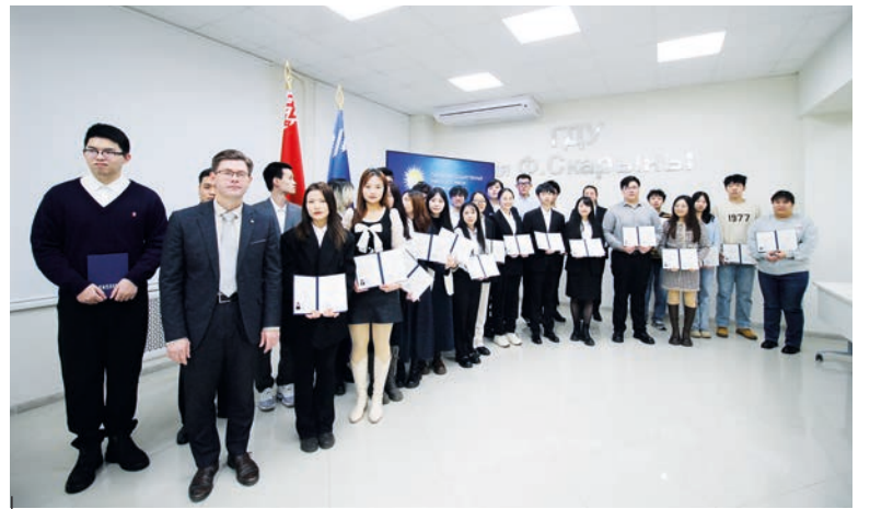
Дипломы бакалавра получили 52 выпускника из числа граждан Китайской Народной Республики. Они обучались в ГГУ по экспериментальному проекту «Реализация модели интеграции образовательной программы I ступени высшего образования (Беларусь) с образовательной программой невуниверситетского высшего образования (КНР) в сокращенные сроки»