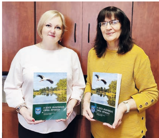
Вывучэнне традыцыйнай духоўнай спадчыны беларусаў – справа важная і пачэсная