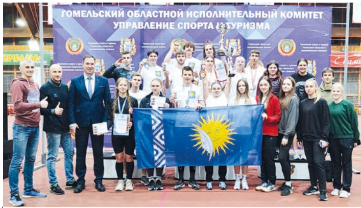
Вручены сертификаты на значок «Готов к труду и обороне» золотого, серебряного и бронзового достоинства 12 нашим студентам

Участникам предстояло показать силы в сдаче восьми нормативов: прыжок в длину с места, подтягивание на