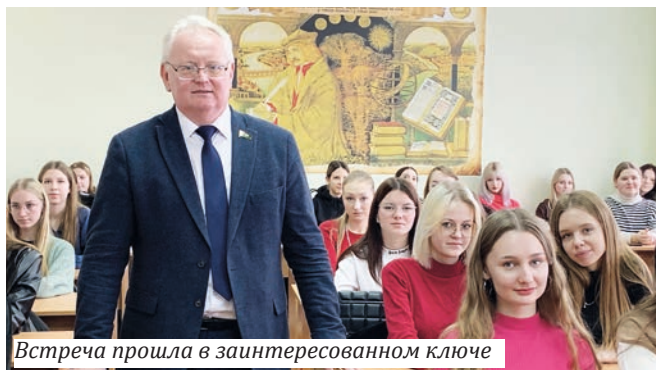
Встреча прошла в заинтересованном ключе