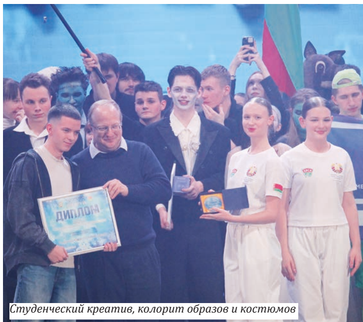
Студенческий креатив, колорит образов и костюмов