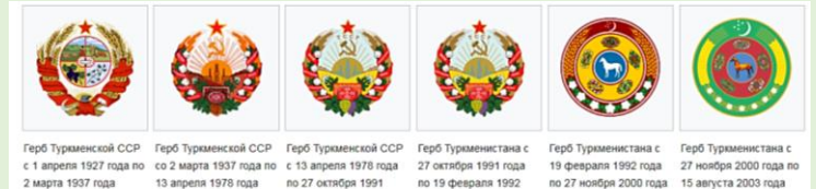
Герб Туркменской ССР с 1 апреля 1927 года по 2 марта 1937 года Герб Туркменской ССР со 2 марта 1937 года по 13 апреля 1978 года Герб Туркменской ССР с 13 апреля 1978 года по 27 октября 1991 г. Герб Туркменистана с 27 октября 1991 года по 19 февраля 1992 г. Герб Туркменистана с 19 февраля 1992 года по 27 ноября 2000 года Герб Туркменистана с 27 ноября 2000 года по 15 августа 2003 года