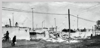
В станом Ташаузе