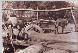
Старый способ подъема воды на поля. Середина 50-х гг. XX века