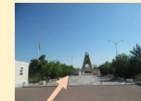
Монумент Победы и памятник туркестанцам, погибшим в ВОВ