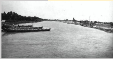
Общий вид на реку Шават около Куля-Ургенча. 1925 г.