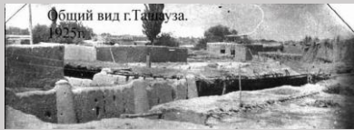
Общий вид г. Ташауза. 1925 г.