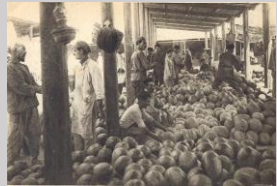
На городском базаре. 30-е гг. XX века