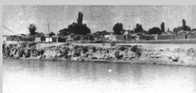
Общий вид старого Ташауза с берега реки Шават. 1939 г.