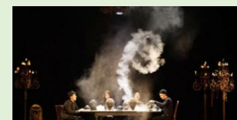
Сцена из спектакля «Сон об осени»

Точно так же, как и в прозе, в пьесах норвежец использует принцип повторения. Одни и те же реплики персонажей звучат по многу раз, а некоторые фрагменты текста и вовсе напоминают стихотворения. Что же касается сюжета, то и здесь Фоссе остается верным своим правилам: событийный ряд скуден, ремарки практически отсутствуют, а конфликты построены на бытовых ситуациях. Драматург повествует о простых людях, главными проблемами которых остаются семейные отношения: любовь, ревность, попытки найти общий язык с близкими. И все-таки именно его пьесы остаются едва ли не самыми востребованными