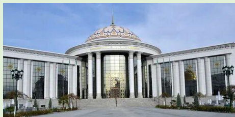
Туркменский государственный университет имени Махтумгулы

Территория простирается на 1100 км с запада на восток и 650 км с севера на юг; большая её часть приходится на пустыню Каракумы. Страна не имеет выхода к Мировому океану. Западная её часть омывается Каспийским морем, крупнейший залив которого — Кара-Богаз-Гол — находится в Туркменистане. По территории страны протекает Амударья, самая полноводная река Средней Азии, получившая название от древнего туркменского города Амуй (ныне Туркменабад). Горные системы включают хребты Большой Балхан, Копетдаг, а также Кугитангау, в пределах которого находится самая высокая точка страны — вершина Айрибаба (3139 м) и самое крупное в мире скопление следов динозавров, расположенных в одном месте (плато динозавров).