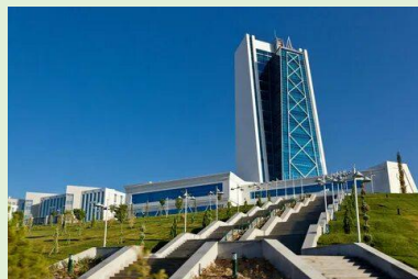
Ашхабад. Международный университет нефти и газа

Крупнейшими отраслями экономики являются нефтегазовый, химический и нефтехимический комплекс, текстильная промышленность, сельское хозяйство и перерабатывающие отрасли АПК, строительство, транспорт и связь, а также машиностроение и металлообработка. Основными статьями экспорта являются природный и сжиженный газ, нефть и нефтепродукты, химикаты и химические удобрения, минералы, хлопок-волокно и хлопчатобумажная пряжа, ткани и текстильные изделия, электроэнергия, строительные материалы, сельскохозяйственная продукция, потребительские товары. Обладает 9,8 % мировых запасов природного газа (4-е место в мире), владеет самым большим в мире газовым месторождением на суше — Галкынйыш; является крупнейшим экспортёром трубопроводного природного газа в Китай.