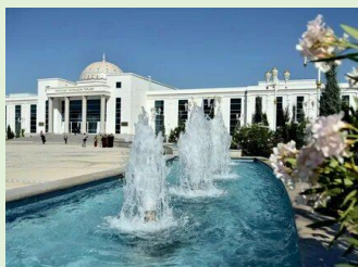
Туркменский университет инженерных технологий имени Огуз хана

Туркменистан представлен пятью объектами в Списке всемирного наследия ЮНЕСКО и шестью элементами в Списке нематериального культурного наследия человечества. Столица государства — город Ашхабад, крупнейший город страны — отмечена в Книге рекордов Гиннеса за ряд достижений.