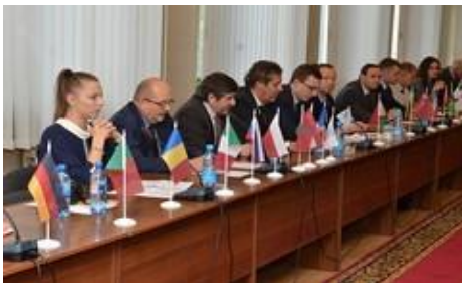
Участники поезда «Экспресс ООН-70» 27 октября 2015 посетили ГГУ имени Ф. Скорины