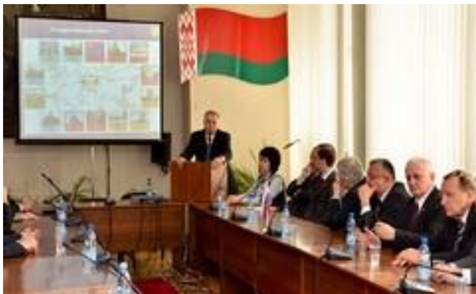
В рамках официального визита в Гомель 27.03.2015 ГГУ имени Ф. Скорины посетила делегация Парламентского Собрания Союза Беларуси и России