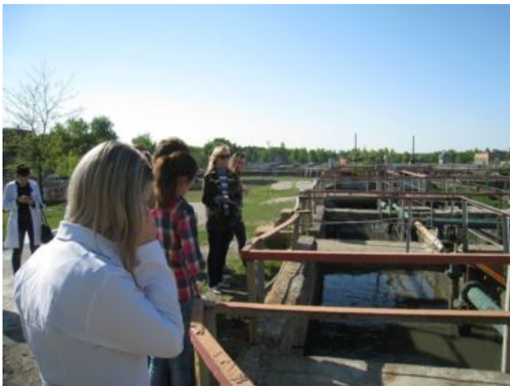
Химическая очистка воды (этап 2)