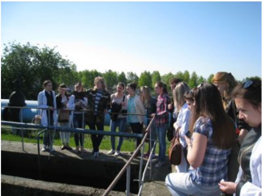
Биологическая очистка воды (этап 4)