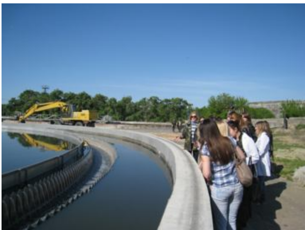
Водоотстойник (этап 3)