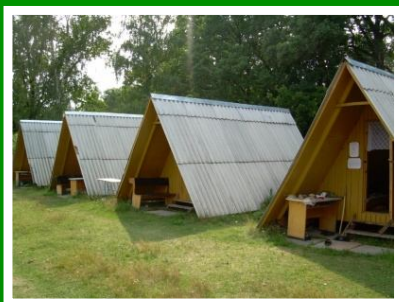
Учебно-научная база ГГУ им. Ф. Скорины «Ченки»