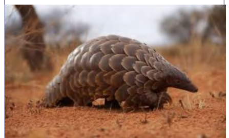
Панголин – отряд плацентарных млекопитающих.

“Линия SARS-CoV-2 циркулировала у летучих мышей в течение 50 или 60 лет, прежде чем перейти к людям”, – говорят исследователи. Ближе к концу 2019 года “кому-то просто очень не повезло”, и он вступил в контакт с SARS-CoV-2, и это вызвало пандемию.