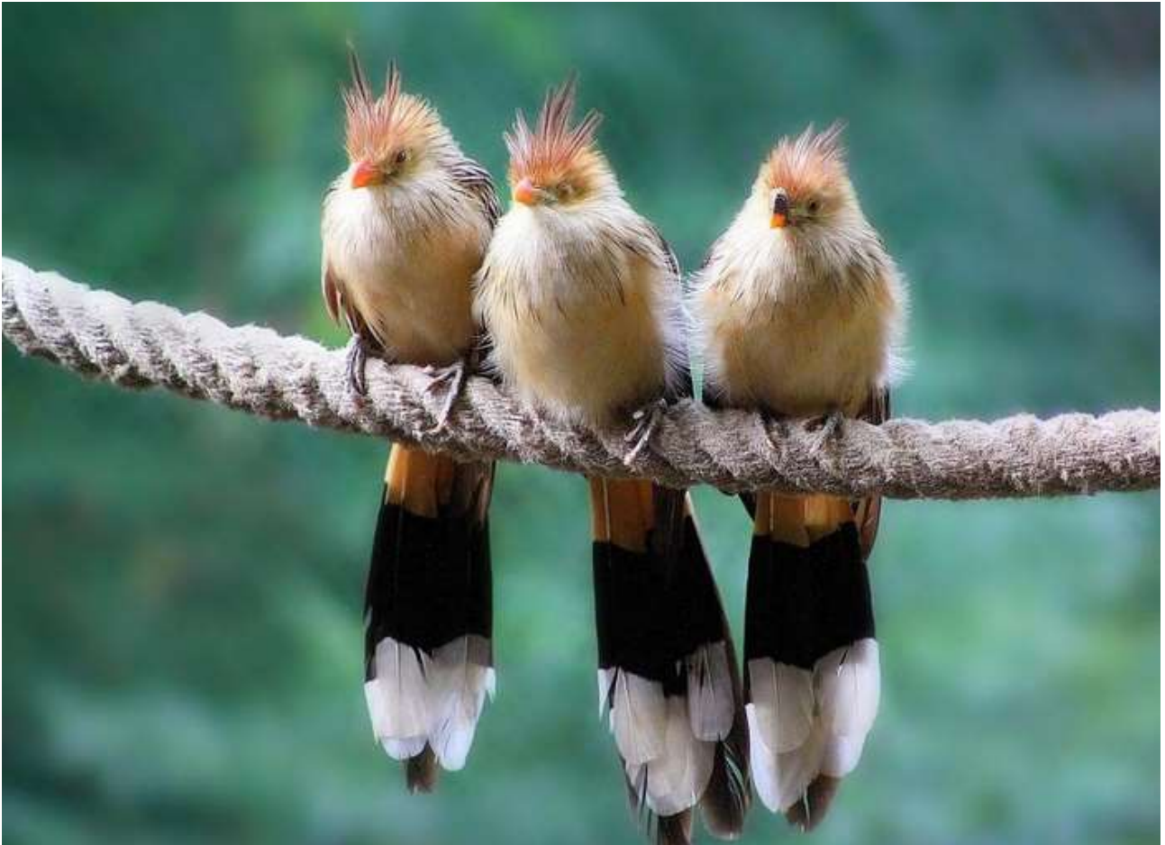
Фото рубрика: «Красота живого мира» «Новости науки»