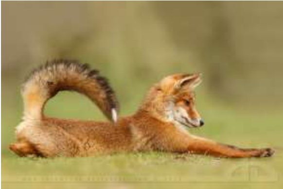
Фото рубрика: «Красота живого мира»