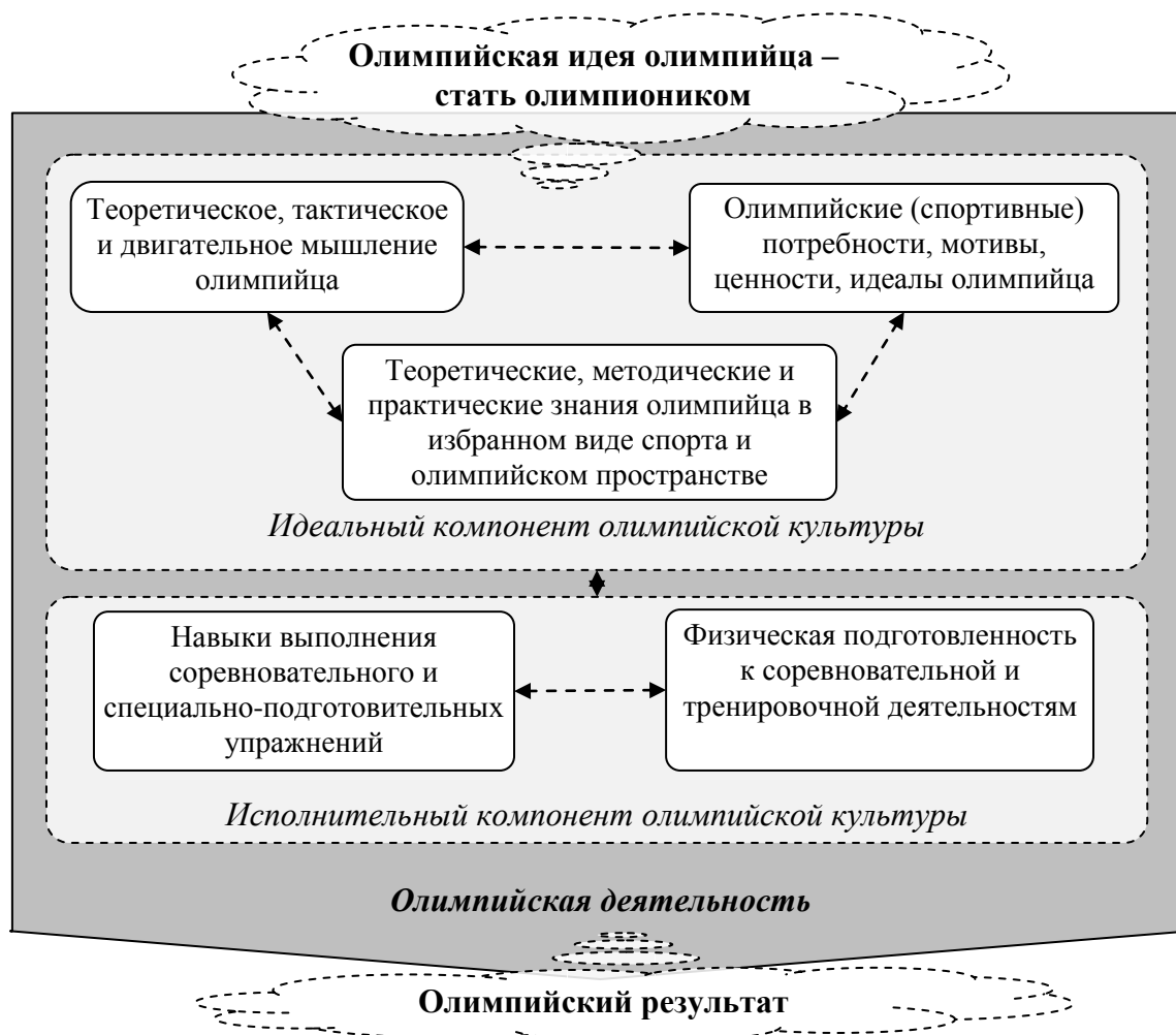
Рисунок 2 - Структурно-функциональная модель олимпийской культуры спортсмена-олимпийца

Для более полной иллюстрации работы модели олимпийской культуры, конкретизируем ее элементы в отношении главного фигуранта олимпийской деятельности – спортсмена-олимпийца (рисунок 2).