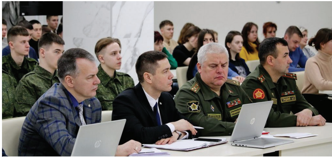
Участники с интересом слушали министра, спрашивали о предварительных результатах совместных учений ВС Беларуси и России, партнерстве двух стран и перспективах срочной службы

напомнил о событиях 2020 года, недопущении цветной революции в стране. Сегодня, несмотря на отсутствия явных признаков непосредственной подготовки к развязыванию агрессии, существует угроза возможного за действия вооруженных сил сопредельных государств, а также воинских формирований ОВС НАТО и ВС США против нашей страны. Присутствие в приграничных районах значительного количества украинских подразделений, в том числе из состава ВСУ, повышает вероятность возникновения вооруженных провокаций, способных перерасти в приграничные инциденты. Для нас важно жить и развиваться мирно и спокойно, как это предусмотрено Конституцией, подчеркнул министр.