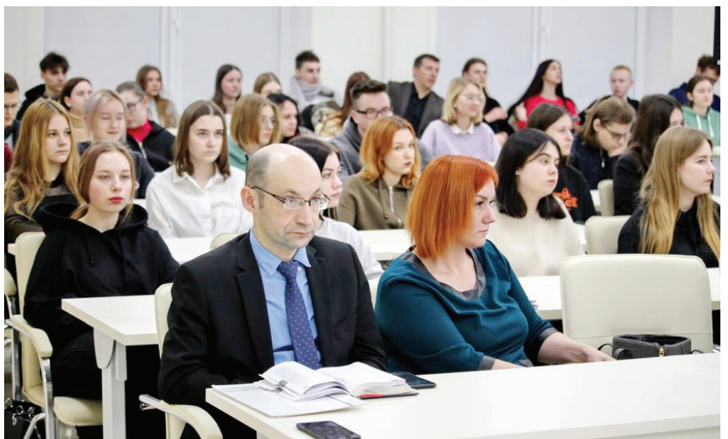
Студенты и преподаватели заинтересованно слушали выступающих

Спектр рассматриваемых вопросов был широк и разнообразен: геноцид и важность патриотического воспитания, профилактика преступлений и правонарушений среди несовершеннолетних, ответственность за совершение преступлений против мира и безопасности человечества, деструктивной направленности.