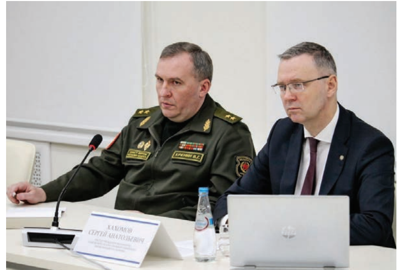
Центральной темой встречи стало обсуждение и информирование о складывающейся военно-политической обстановке в стране и мире

Министр обозначил расстановку сил на мировой арене,