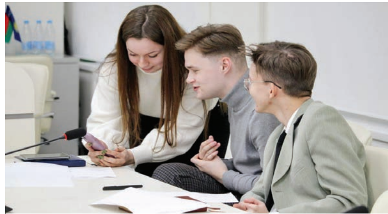
Студсовет держит фокус внимания на интересах молодежи

Он рассказал о результатах опроса, проводимого среди студентов очной формы обучения.