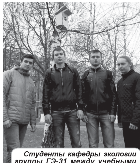
Студенты кафедры экологии группы ГЭ-31 между учебными корпусами № 2 и № 3 развешивают гнездовья для птиц с белорусской символикой.