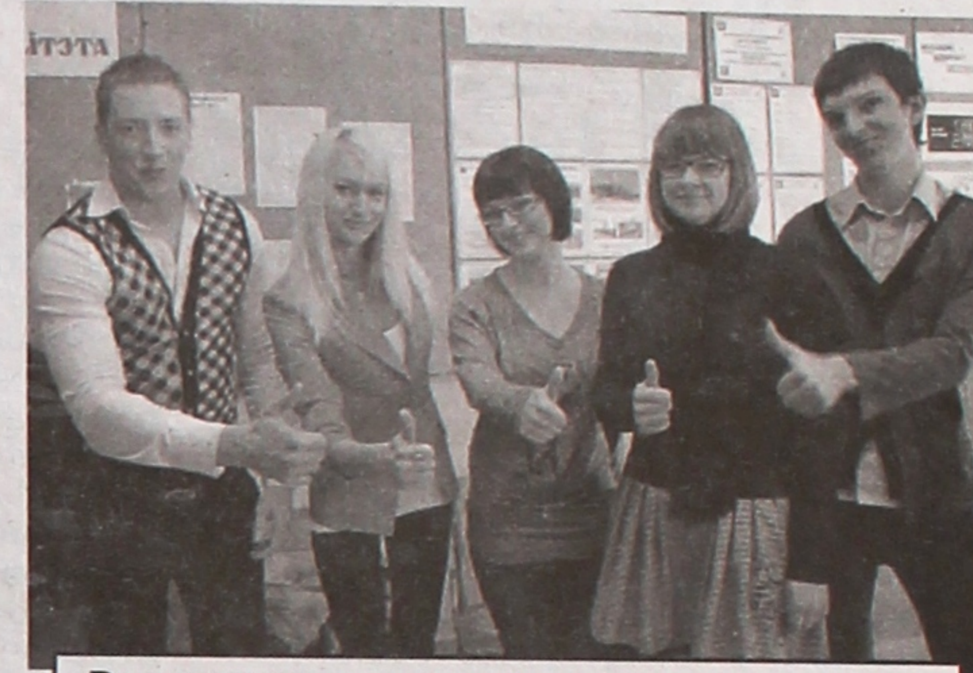
Выпускники специальности «геология и разведка месторождений полезных ископаемых»

Как встретит незнакомый коллектив новоиспеченного специалиста, будет ли предоставлено жилье на новом месте... Эти и другие вопросы волновали выпускников, ставивших на распределении свою подпись, подтверждающую их согласие на предоставляемое рабочее место. И где бы ни при-