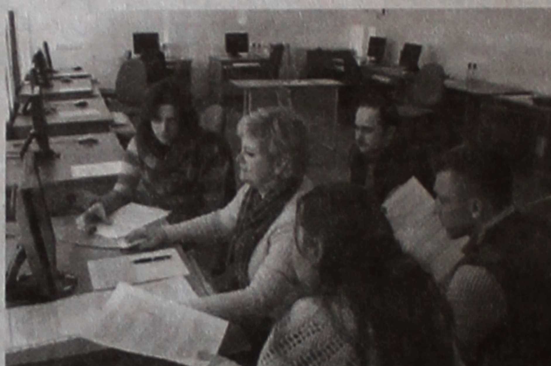
На снимке: жюри оценивает результаты участников олимпиады.

Прошла первая из олимпиад, организуемых экономическим факультетом в этом учебном году.