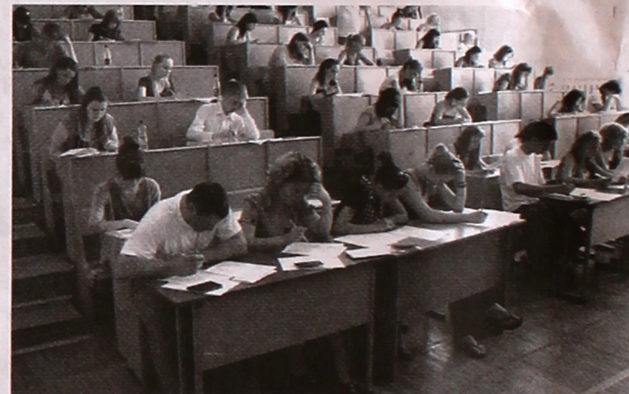
(Материалы подготовлены по данным приемной комиссии).

В рядах новоиспеченных студентов также – 13 детей-инвалидов, 19 молодых людей, которые до поступления в ГГУ прошли довузовское обучение. На условиях целевой подготовки в наш вуз поступили 105 человек.