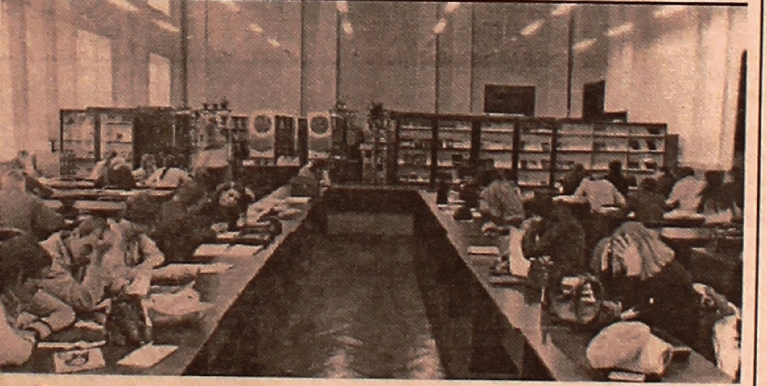
Так выглядае цяпер чытальная зала корпуса №2.

ры, устаноўка жалюзі на вокнах. Студэнтам падабаецца працаваць тут, – адзначае дырэктар бібліятэкі В.М. Касцючэнкава. – Зала разлічана на 130 пасадачных месцаў, у распараджэнні чытачоў – навейшая вучэбная і навуковая літаратура, перыядычныя выданні па гісторыі, юрыдычных, матэматычных дысцыплінах, па біялогіі, экалогіі, хіміі, геалогіі, фізічнаму выхаванню, мастацтву. Тут жа можна карыстацца падручнікамі, вучэбнымі дапаможнікамі, навуковай літаратурай па гісторыі Беларусі, ідэалогіі беларускай дзяржавы, іншых гуманітарных і сацыяльна-эканамічных дысцыплінах.