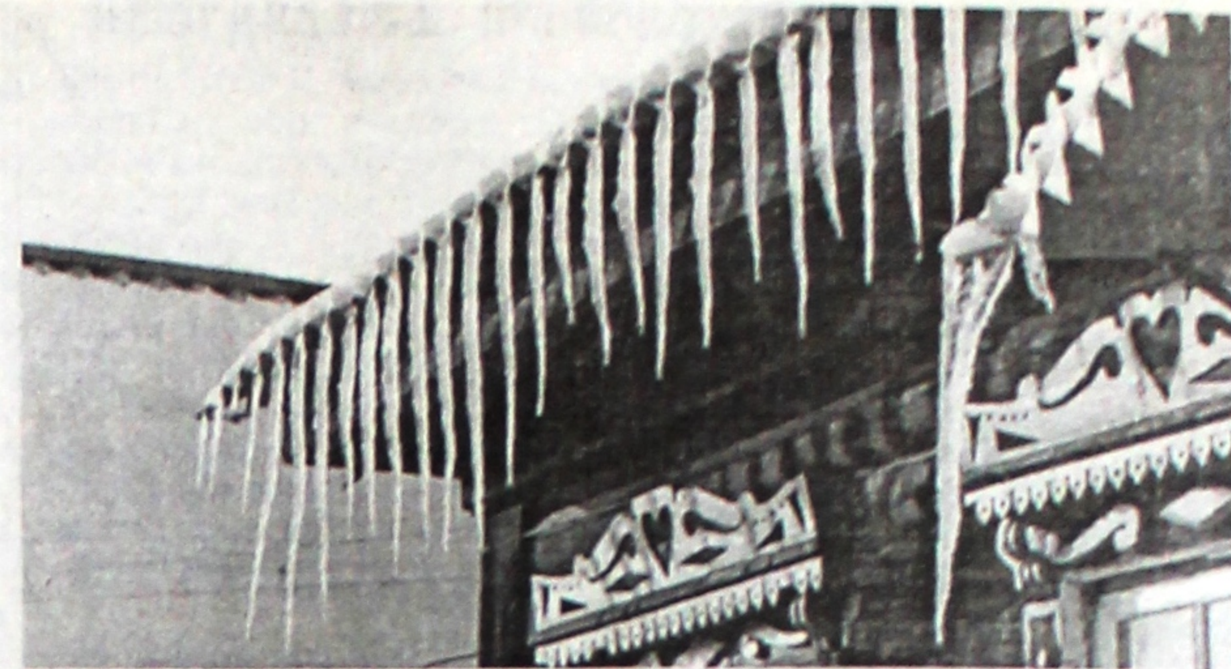
Гребешок марта.

І. ШТЭЙНЕР, загадчык кафедры беларускай літаратуры, д.ф.н., прафесар.