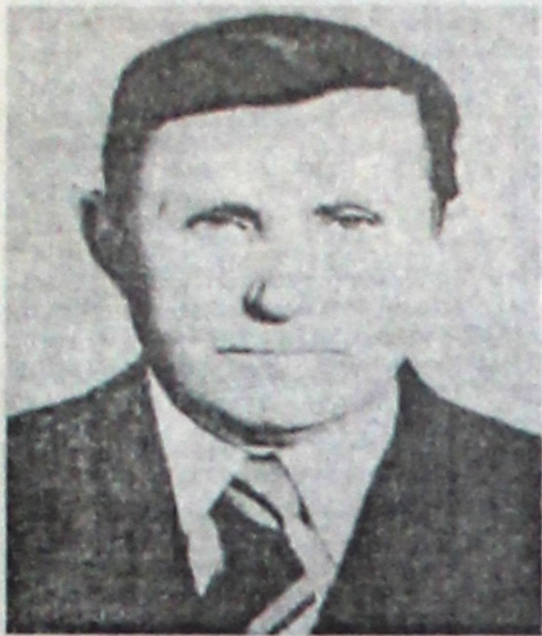
Чакалі вусны, Зоры, песні... Вясеце б справіць нам... Але

Цяжкі снарад – Вайны прадвеснік – Не затрымаўся ў ствале.