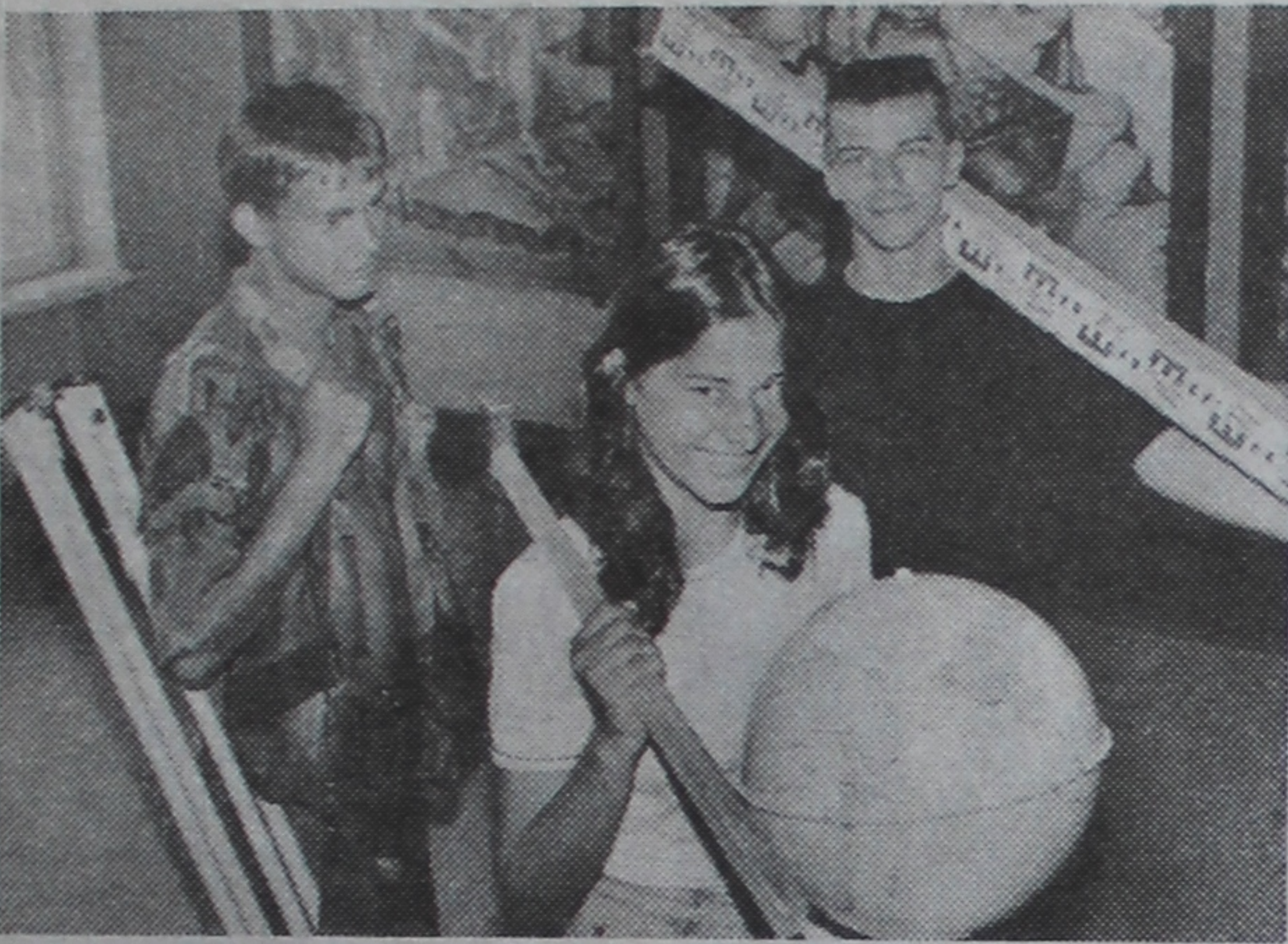
Будучыя геологі перад адпраўкай на практыку.

А.ІЛЫНЧЫК, ст.выкладчык кафедры геалогіі і разведкі карысных выкапняў.