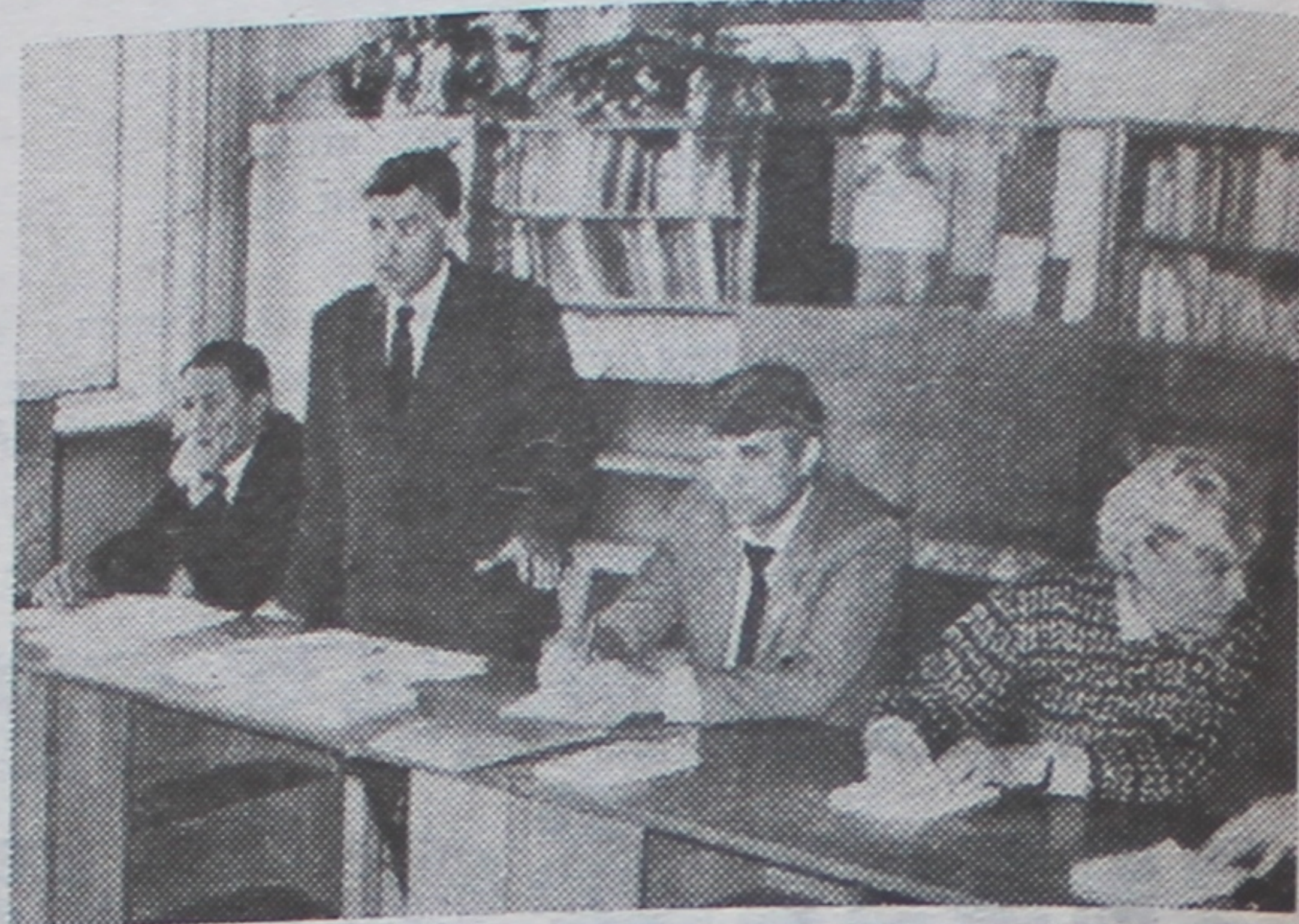
АДКРЫЦЦЁ КАНФЕРЭНЦЫІ.

У гэтым аспекце апублікаваны ў кнізе матэрыялы расцэньваюцца як важная падзея ў рэгіёне, бо яны ахопліваюць многія бакі праблем