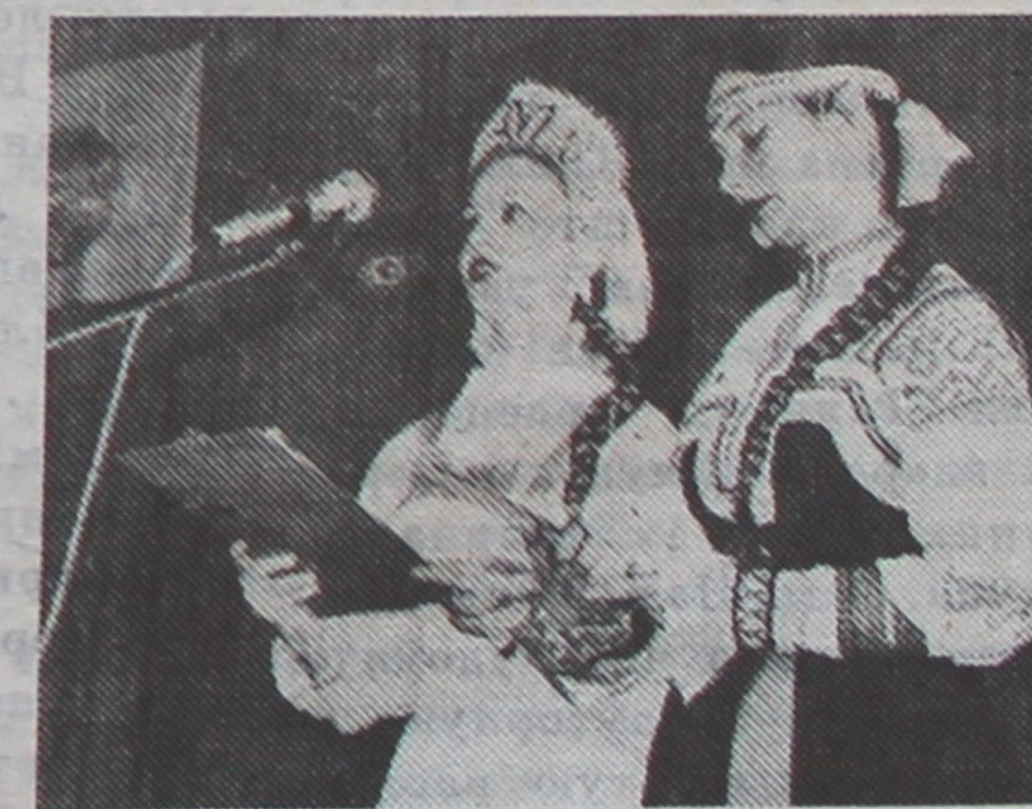
На здымках: удзельніцы ансамбля расказваюць аб сваім калектыве; у час выступлення.

прыгожыя касцюмы прынеслі калектыву заслужанае прызнанне не толькі ў Расіі, але і ў краінах далёкага і бліжняга замежжа. Варта таксама адзначыць, што выпускніцай