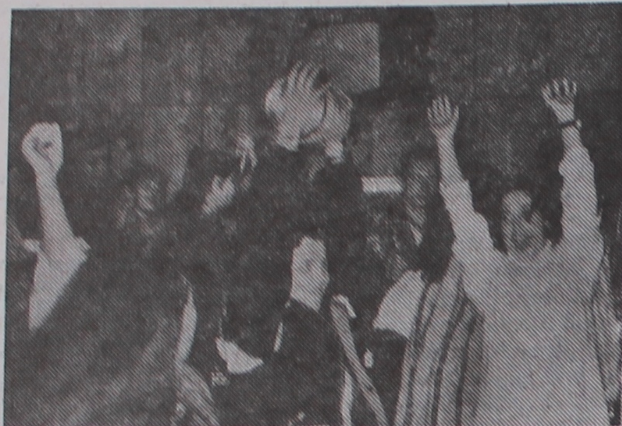
Радость студентов-экономистов при получении приза зрительских симпатий, учрежденного спонсором конкурса.

Неплохие программы, волею случая с идентичными персонажами, показали студенты факультета физической культуры и физики. Но недоработано