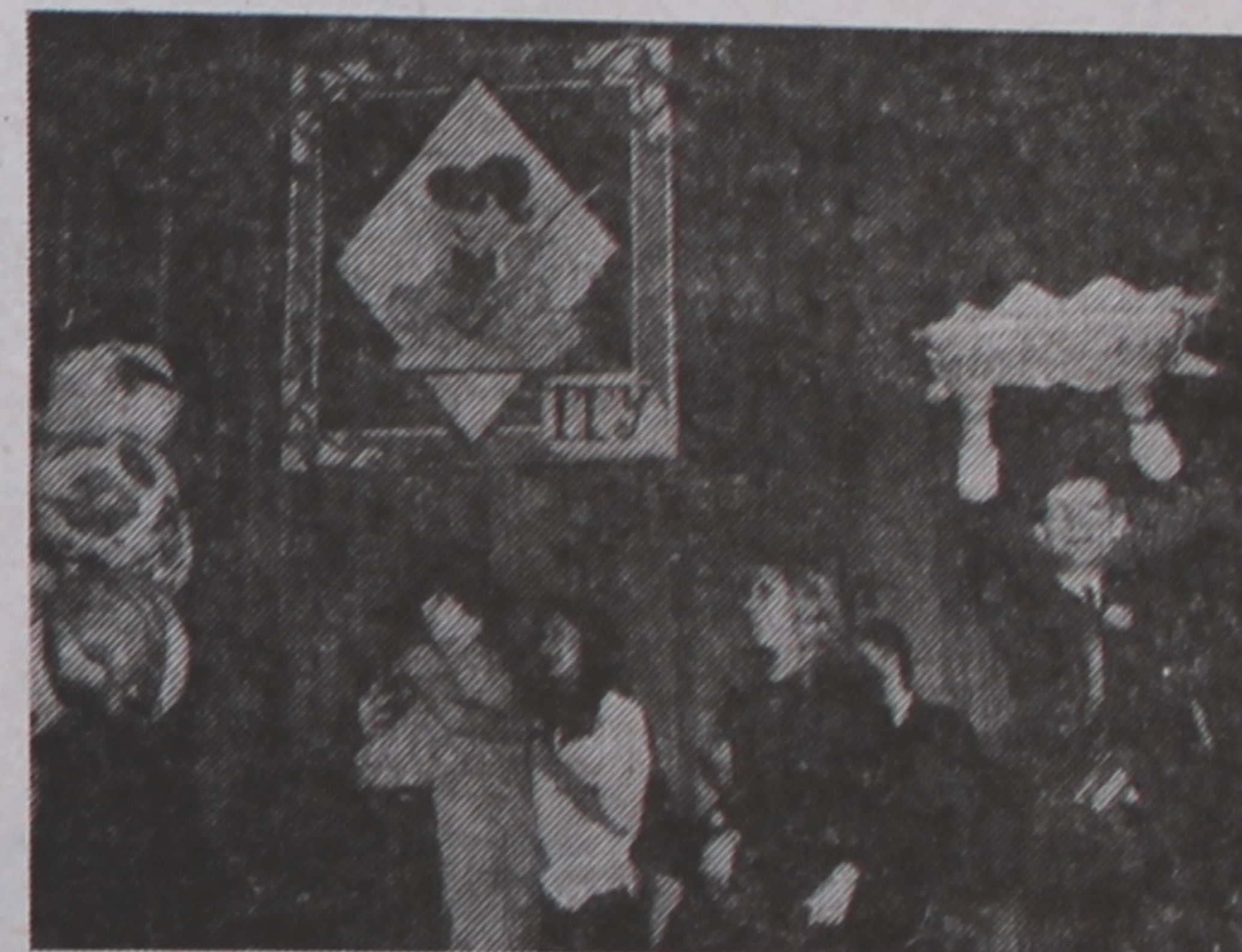
Победители конкурса -- первокурсники биологического факультета.