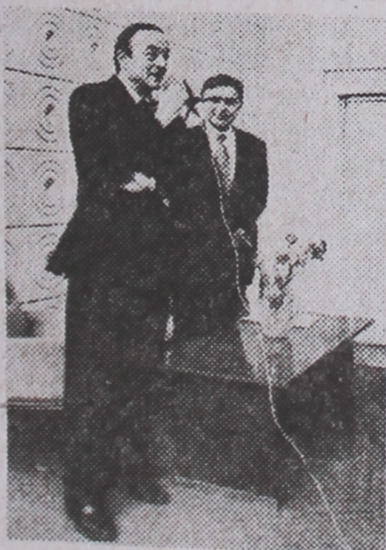
На ўрачыстым адкрыцці Франка-беларускага інстытута кіравання выступае прафесар Морыс Шэневуа.

У прыватнасці, у мінулым годзе французскія калегі сумесна з кіраўніцтвам Гомельска-