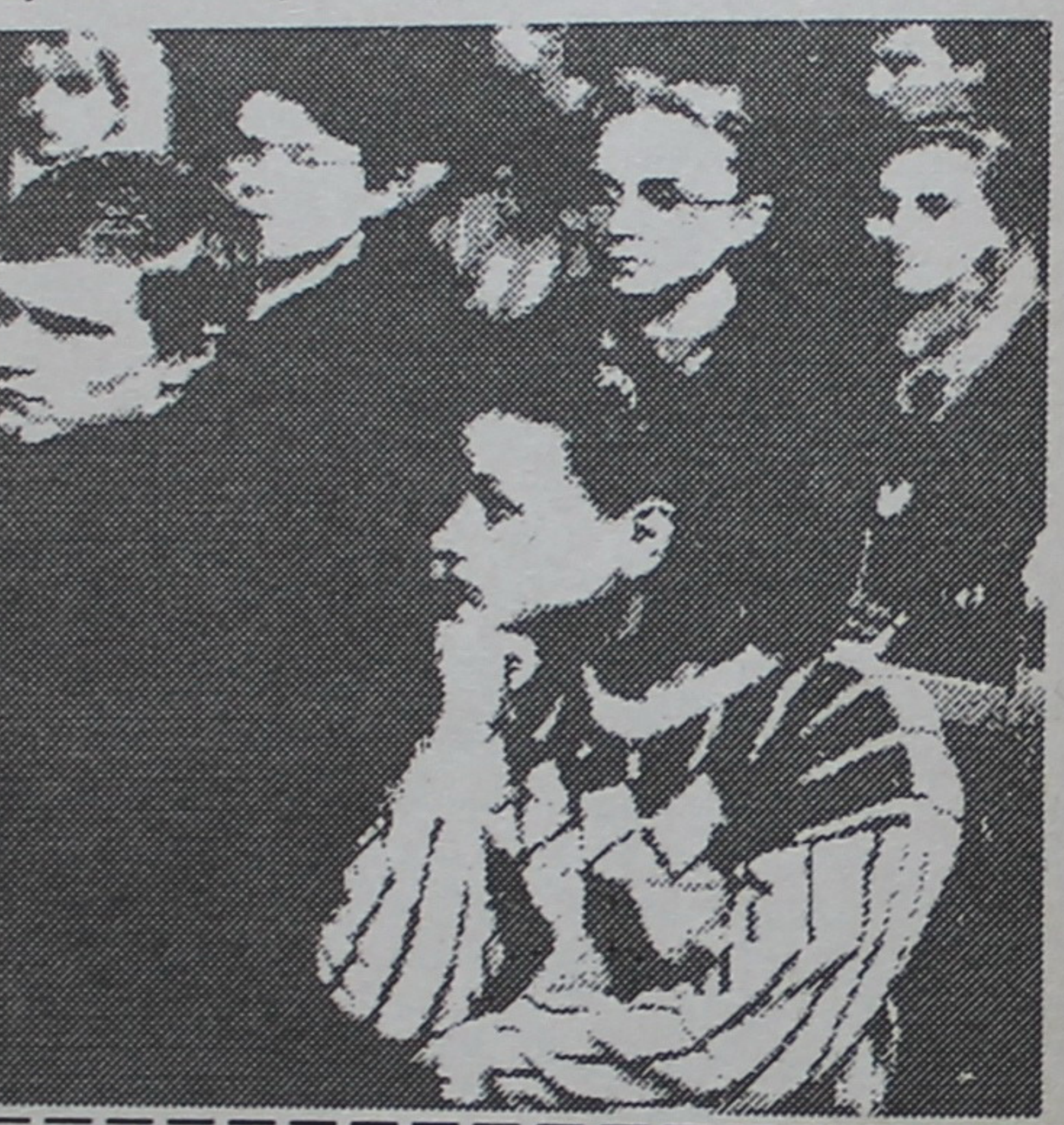
ЗААПОГІЯ - ГЭТА ПОШУК

На такую тэму адбылася гутарка са студэнтамі біялагічнага факультэта, якая праходзіла ў інтэрнаце ў рамках Дзён кафедры заалогіі і аховы прыроды. Будучыя біёлагі даведаліся шмат новага аб экспедыцыях кафедры заалогіі ў 1975-87 гг. у Калмыкію, Кіргізію, Крым, на Каўказ, у дэльту Волгі, а таксама правядзенні практык і экспедыцый на тэрыторыі Беларусі -- на Прыпяці, 1 Беразіне, Дняпры, Сожы, у Прыпяцкім, Бярэзінскім запаведніках, Нацыянальным парку "Белавежская Пушча".