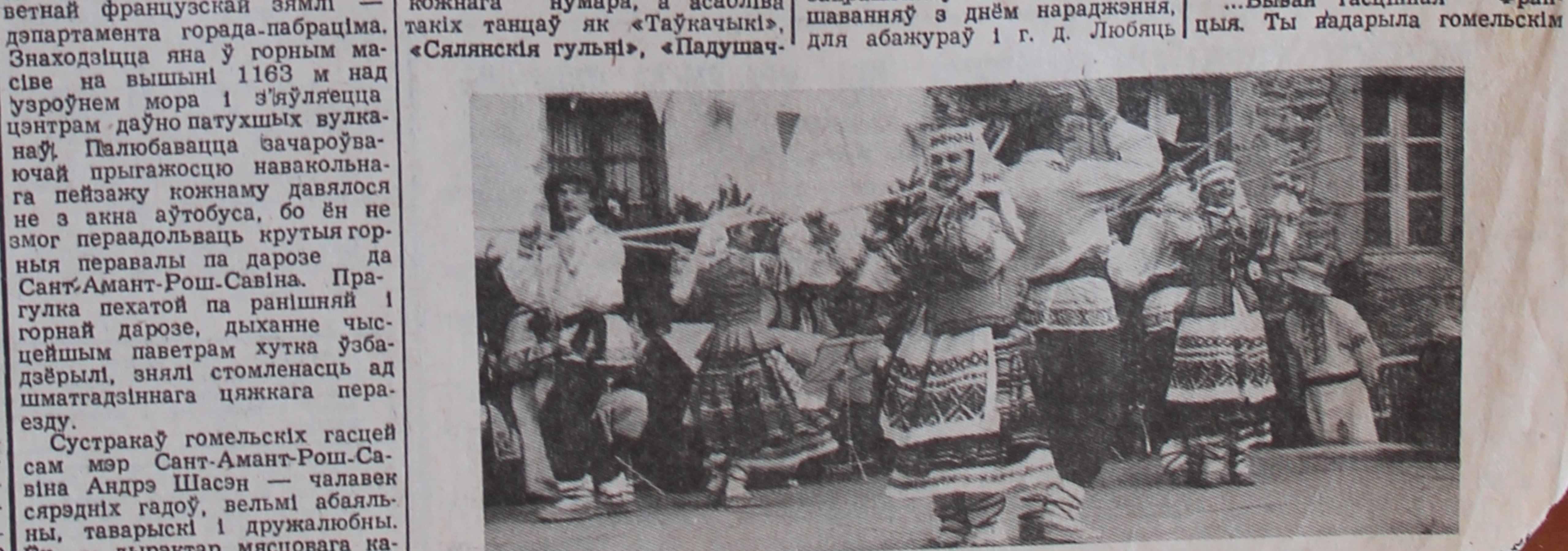
на здымку: канцэрт «Радзімічаў» у Даранжы,

Апошні дзень на французскай зямлі быў, бадай, адным з на ўласныя вочы пабачыць славуты Парыжі З яго Эйфегалінкі левай вежай і Луўрам, Трыумфальнай аркай і Елісейскімі выкарыстоўваюць палямі, Манмартрам і найпры-