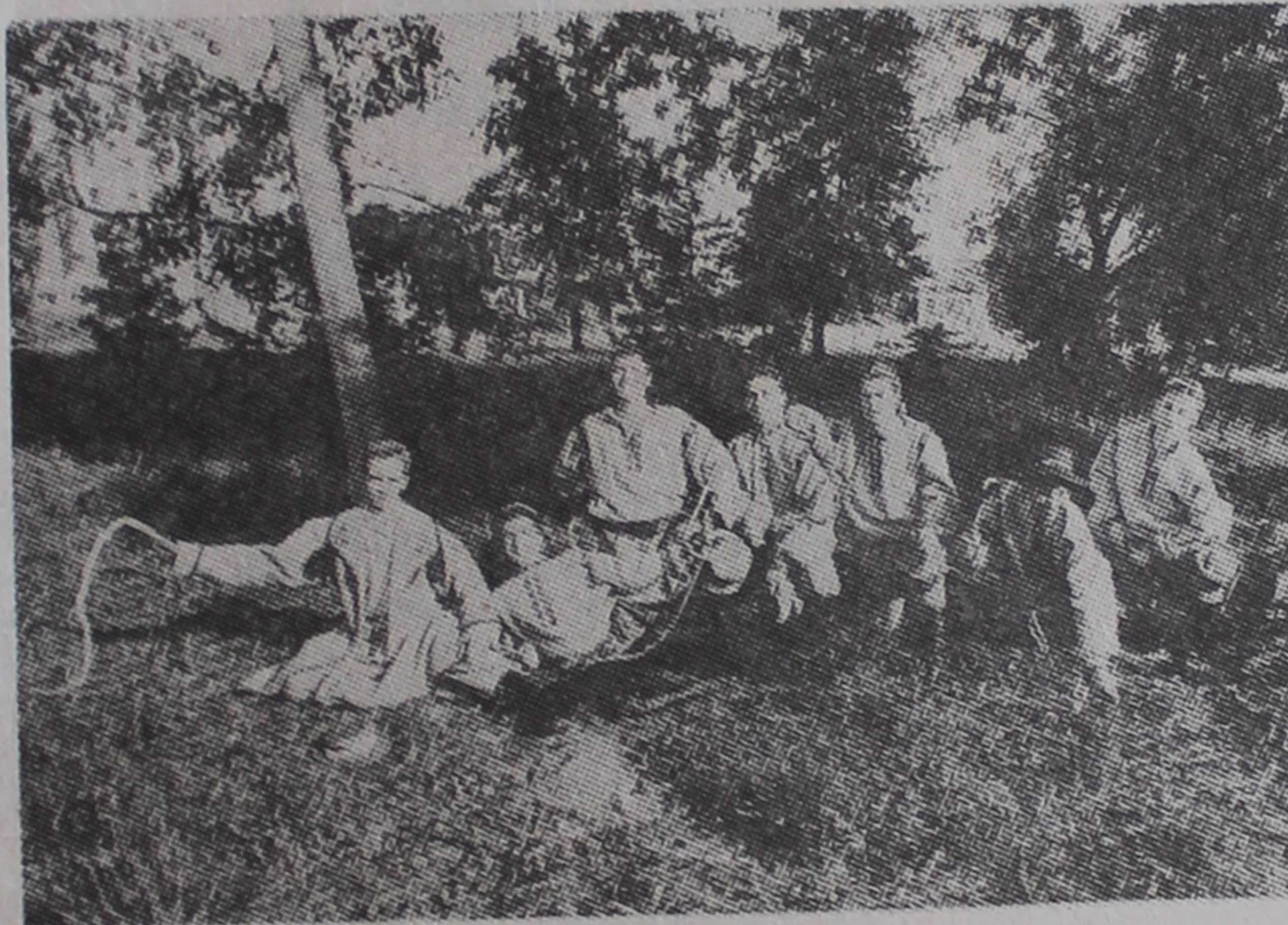
Мужчынская група народнага фальклорна-харэаграфічнага ансамбля «Радзімічы».

«Дзяніца» дала адзін канцэрт у зале педагагічнага вучылішча і адбыліся 3—4 яе выходы ў праграмах фестывалю. А толькі ж некалькі гадзін язды адмяжоўвалі іх ад вядомага Сафійскага сабора Полацку; іх з задавальненнем прынялі ў сцэнах мясцовай ратушы, у канцэртных залах горада Віцебска. Маючы папярэдняю дамоўленасць са студэнцкім клубам ГДУ аб гэтых канцэртах, па прыездзе ў аргкамітэта, напэўна, «не дайшлі рукі» да калектыву, які ведаюць за межамі вобласці, Беларусі, ды і