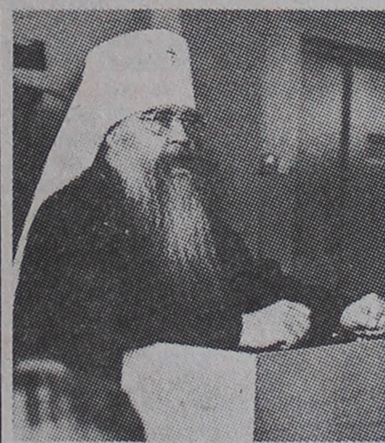
Выступае мітрапаліт Мінскі і Слуцкі Філарэт.

У час адкрыцця музея-лабараторыі пры шырокай аўдыторыі прысутных выступіў рэктар ГДУ член-карэспандэнт АН Беларусі Л. А. Шамяткоў