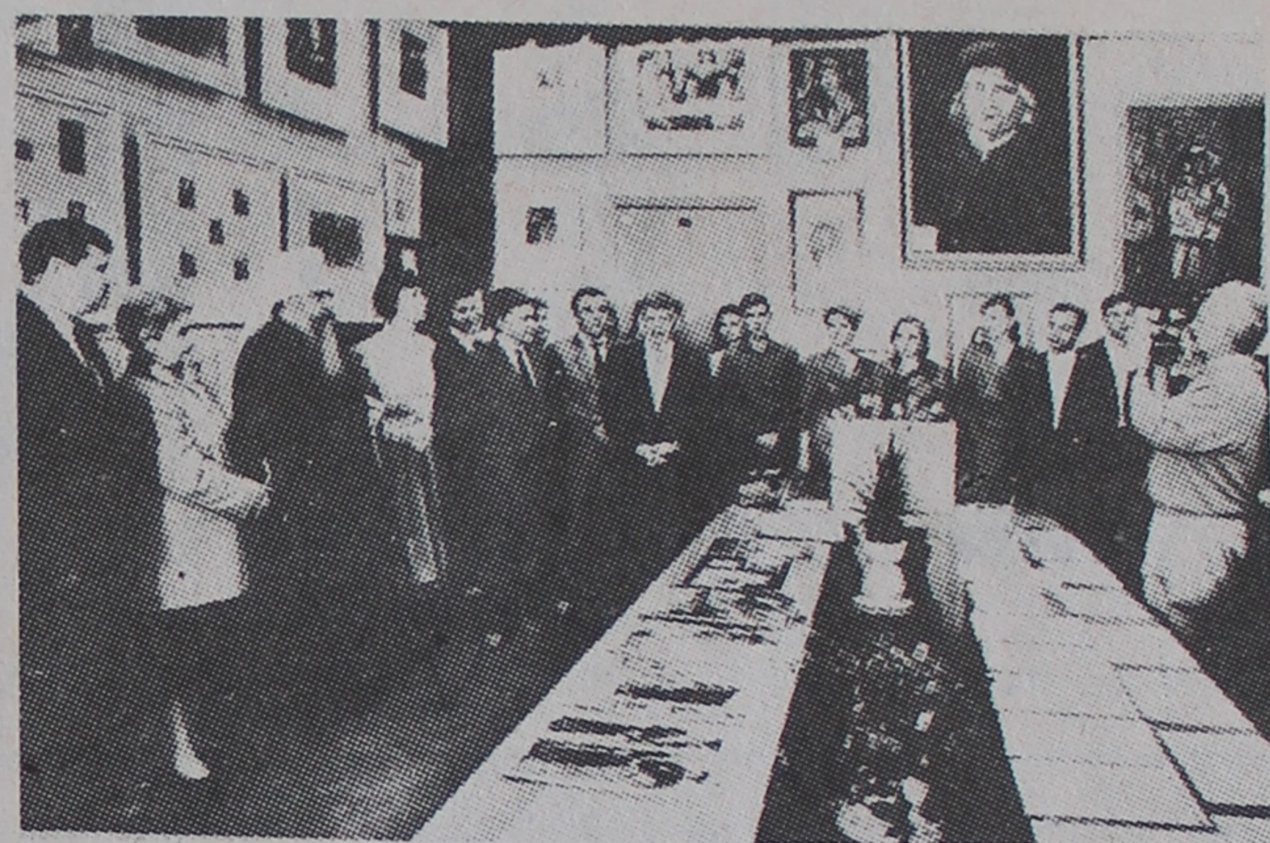
Першыя наведвальнікі музея-лабараторыі Францыска Скарыны.

і старшы навуковы супрацоўнік Гомельскага філіяла Нацыянальнага навукова-асветніцкага цэнтра імя Ф. Скарыны прафесар У. В. Анічэнка. Яны