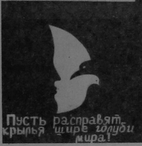
Палітычныя плакаты, прадстаўлены на конкурс.

стварыць інтэрнацыянальны атрад бязвышлатнай працы, які б выехаў у жыццў наступнага лета на які-небудзь народнагаспадарчы аб'ект вобласці. Заароблены такім атрадам грашовыя сродкі плануецца пералічыць у фонд дапамогі якой-небудзь з арганізацый краін Азіі і Афрыкі, што змагаюцца за сваю незалежнасць. Кідаўцы