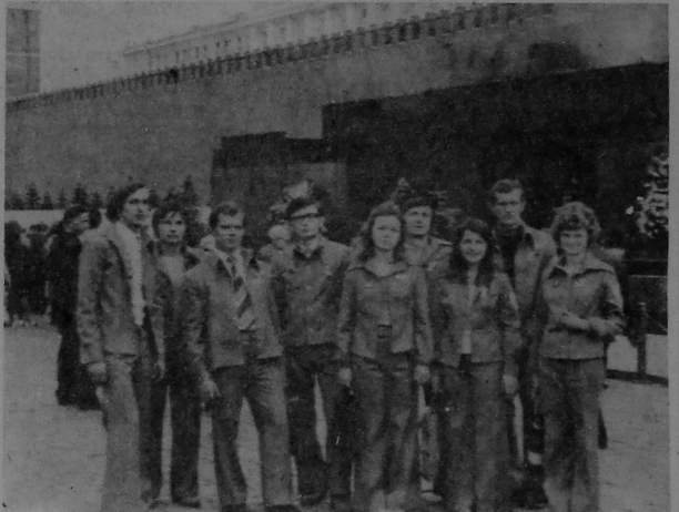
Гэты здымак быў зроблены летам 1976 года. Каля Маўзалей У. І. Леніна — інтэрнацыянальны СВА, байцамі якога ў пераважнай большасці з'яўляліся студэнты эканамічнага факультэта.

Гісторыя існавання эканамічнага факультэта не такая ўжо і вялікая — 17 гадоў. Але за гэты час ён здолее стаць адным з вядучых ва ўніверсітэце.