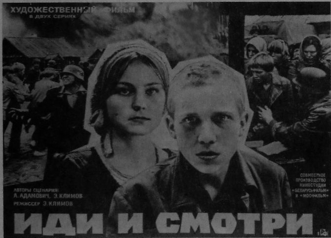
ХУДОЖЕСТВЕННЫ І ФІЛЬМ «ІДІ І ГЛЯДІ» А. АДАМОВІЧ, Э. КЛІМОВ

Мастацкі фільм «Ідзі і глядзі» будзе дэманстравацца ў кінатэатры «Спартак» 14—16 лютага. Пачатак сеансаў: 10, 14, 30.