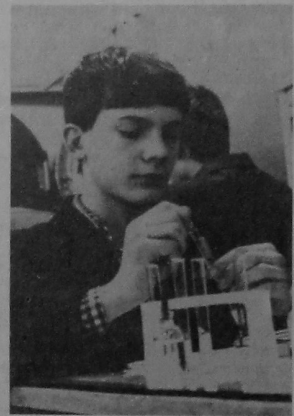
Ігінальна складала варыянты работ, указала неабходныя для выканання работ спецыфічныя рэактывы. Работы працавалі сканцэнтравана, дакладна. Аднак, не ўсе вучні змаглі рашыць адну з задач. Слабым месцам ў рабоце большасці вучняў была метадыка выканання эксперымента. Правядзенне лабараторных работ у школе ў перспектыве будзе займаць вялікую ўдзельную вагу ў праграме па хіміі. Як паказвае вопыт правядзення лабараторных тураў, вучні з захапленнем працуюць, развіваюць сваю пазнавальную дзейнасць, актывізаваюць мысленне на практычных занятках.

Кафедра падрыхтавала ўсё неабходнае абсталяванне, рэактывы да практычнага тура, ары-