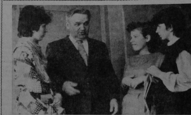
Па слядах нашых выступленняў

З вялікай адказнасцю аднесліся да палітзаліку на матэматычным факультэце.