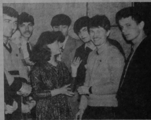
НА ЗДЫМКАХ: 1. Было аб чым расказаць адзінаму і гаспадарам, і гасцям Дзёні дружбы-86. 2. На кірмаш салідарнасці студэнты ўніверсітэта прадставілі свае самыя разнастайныя све-

іры, кандытарскія вырабы. Грошы, вырачаныя ад продажу ўсяго зробленага іх рукамі, пералічаны ў Саветскі Фонд міру.