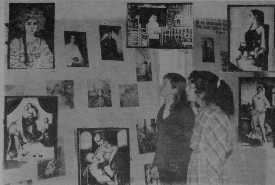
НА ЗДЫМКУ: наведвальнікі выстаўкі знаёмяцца з прадстаўленымі ім ёй рэпрадукцыямі кар-