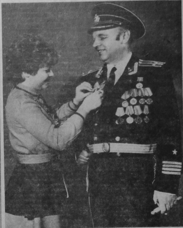
ВОИНАМ — ВЯЛІКА ПШАНА.

Сёння савецкі народ і яго доблесныя воіны, працоўныя братніх краін і ўсё прагрэсіўнае чалавечтва ўрачыста адзначаюць 67-ую гадавіну Савецкай Арміі і Ваенна-Марскога Флоту.