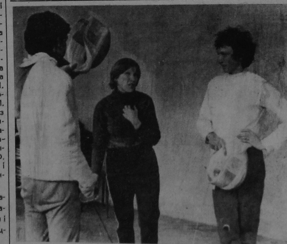
СТВАРЭННЕ ВОЮ.

вання нашага ўніверсітэта А. Казаўскі, які ўсё больш і больш радуе аматараў барацьбы сваімі паспяховымі паядынкамі на дыване.