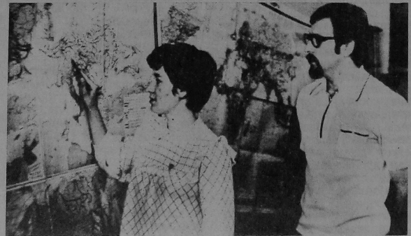
тэтах, факультэце фізвыхавання. НА ЗДЫМКУ: экзамен па гісторыі КПСС у студэнткі геафака

У кожным корпусе ўніверсітэта пануе дыяспра асаблівых настрой — хвалючы. Гэта і зразумела: ідзе чарговае выпрабаванне на веды студэнтаў — залікова-экзаменацыйная сесія. Абыякавасці, недобрадумленнасці ў адносінах да сябе яна «не любіць». Праўда, не ўсе гэта чамусьці ўсвядомілі. Таму здараюцца прыкрыя зрывы і «правалы». Іх прычыны шукаць далёка не трэба — пропускі заняткаў, абыякавыя адносіны да вучобы і недастаткова строга кантроль за дысцыплінай з боку куратараў, дэканатаў. Адсюль і адпаведныя вынікі — невысокі ўзровень паспяхоўнасці ў час сесіі. Асабліва гэта датычыць геалагічнага факультэта, дзе сесія ў асноўным завяршылася і вынікі яе — не зусім радасныя. У разгары экзамены на эканамічным, біялагічным факультэтах, факультэце фізвыхавання.