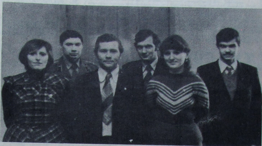
ПРАЛЕТАРЫІ УСІХ КРАІН, ЯДНАЙЦЕСЯ!

(З кнігі Генеральнага сакратара ЦК КПСС Старшыні Прэзідыума Вярхоўнага Савета СССР Л. І. Брэжнева «Успаміны»).