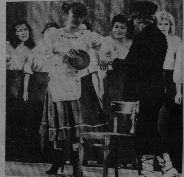
Многія камсамольцы радыёзавода актыўна ўдзельнічаюць у гуртках мастацкай самадзейнасці.

Н. КУЗНЯЦОВА, сакратар гаркома камсамола.