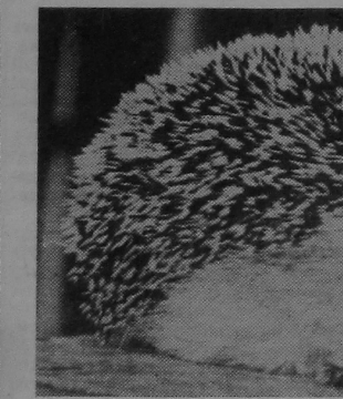
Работа выканана Т. Бандарніка.

шак, якія гняздуцца на зямлі, птушаняты, яшчаркі, жабы. Сустракаюцца ў яго раёчыне парасткі і насенне злакаў. А вось змей вушасты вожык пазбягае. Жыхарка паўпустынь горава сама не супраць паласавання вожыкам. Пры гэтым іголка не в'яжляюцца перашкодай. Наогул, ворагаў у вожыка хапае: