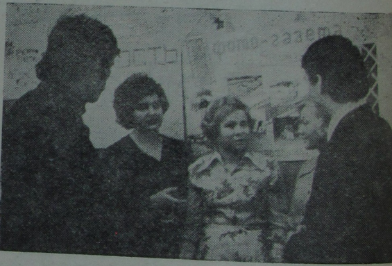
На вечары працоўнай славы былі выстаўлены лепшыя насценгазеты будаўнічых атрадаў, ля якіх сфагараваны актывісты студэнткіх будаўнічых руху.

У кожным будаўнічым атрадзе ўніверсітэта вялікая ўвага надавалася насценнаму друку. У газетах, «баявых лістках» і «маланках» шырока адлюстравалася працоўная дзейнасць студэнтаў, іх вялікая прапагандысцкая і культурна-масавая і шэфская работа. Насценны друк з'явіўся важным сродкам у мабілізацыі ўсіх байцоў СБА на паспяховае выкананне сацыялістычных абавязанасцей.