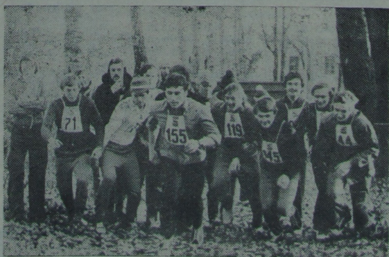
Ва ўніверсітэце праведзена асенні лёгкаатлетычны крос. НА ЗДЫМКУ: старт аднаго з забэгаў.

В. ДЗЕМ'ЯНКОЎ, старшыня камітэта ДТСААФ.