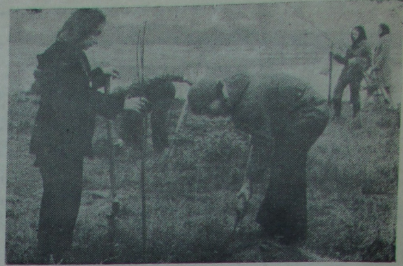
Пройдзе час, і ў раёне Валатавы вырасце новы ўніверсітэцкі гарадок. Але ўжо цяпер студэнты ГДУ клопаціцца аб упрыгожванні гэтай мясціны.