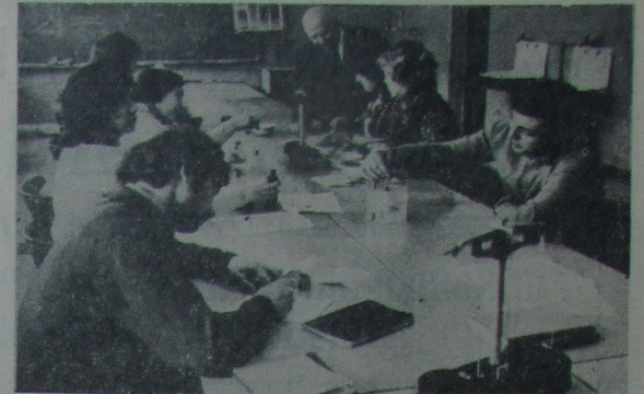
Рамантычная прафесія геолога. Добра авалодаць ёй можа толькі той, хто набудзе трывалыя тэарэтычныя веды і замацуе іх на практыцы.