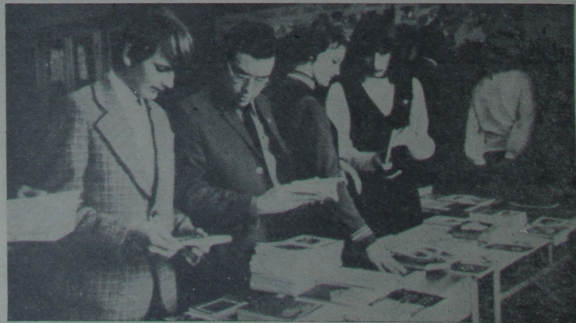
Дэлегаты канферэнцыі ў час перапынкаў ахвотна набывалі для сябе мастацкую літаратуру, продаж якой быў наладжан ў файе актывай залы.

В. Вайцянюк указаў і на тых недахопах, якія мелі месца