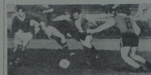
У Гомелі адбыліся занаўныя спаборніцтвы ВНУ па футболе. НА ЗДЫМКУ: момант гульні каманд ГДУ і РТІ. З лікам 9:0 перамаглі гамельчане.