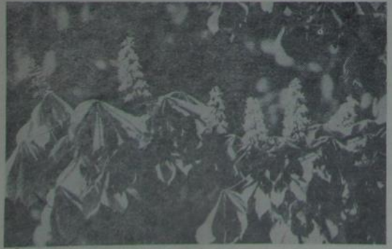
ЗНОЎ ЦВІТУЦЬ КАШТАНЫ... Фотаафод.

Ціністыя стройныя кроны Шурпатых аб'ёмістых драў Між лісцяў зубчастых, зялёных, хваляюць птушыны свой спеў. Рабіна, бірозы і клёны Слухаюць гэты напеў. І кожны той гук улюбёны На памяць у сэрцы засеў. Здаецца, мне толькі ў Палесці Мелодыю гэтую чуў. Дзе пахне вясновай ірвалескай, Дзе гэтак гамоняць лісьце — Усёды знайсці і хаць Часцінку радзімай красы.