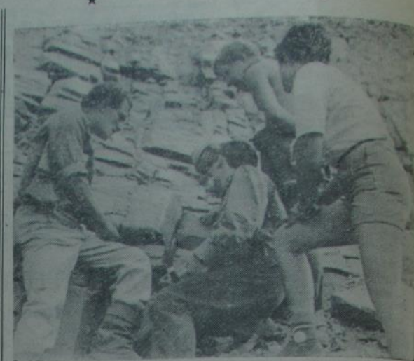
Вось так, камень за каменем, будучыя геологі разгадваюць тайны нашай планеты, авалодваюць сваёй прафесіяй.