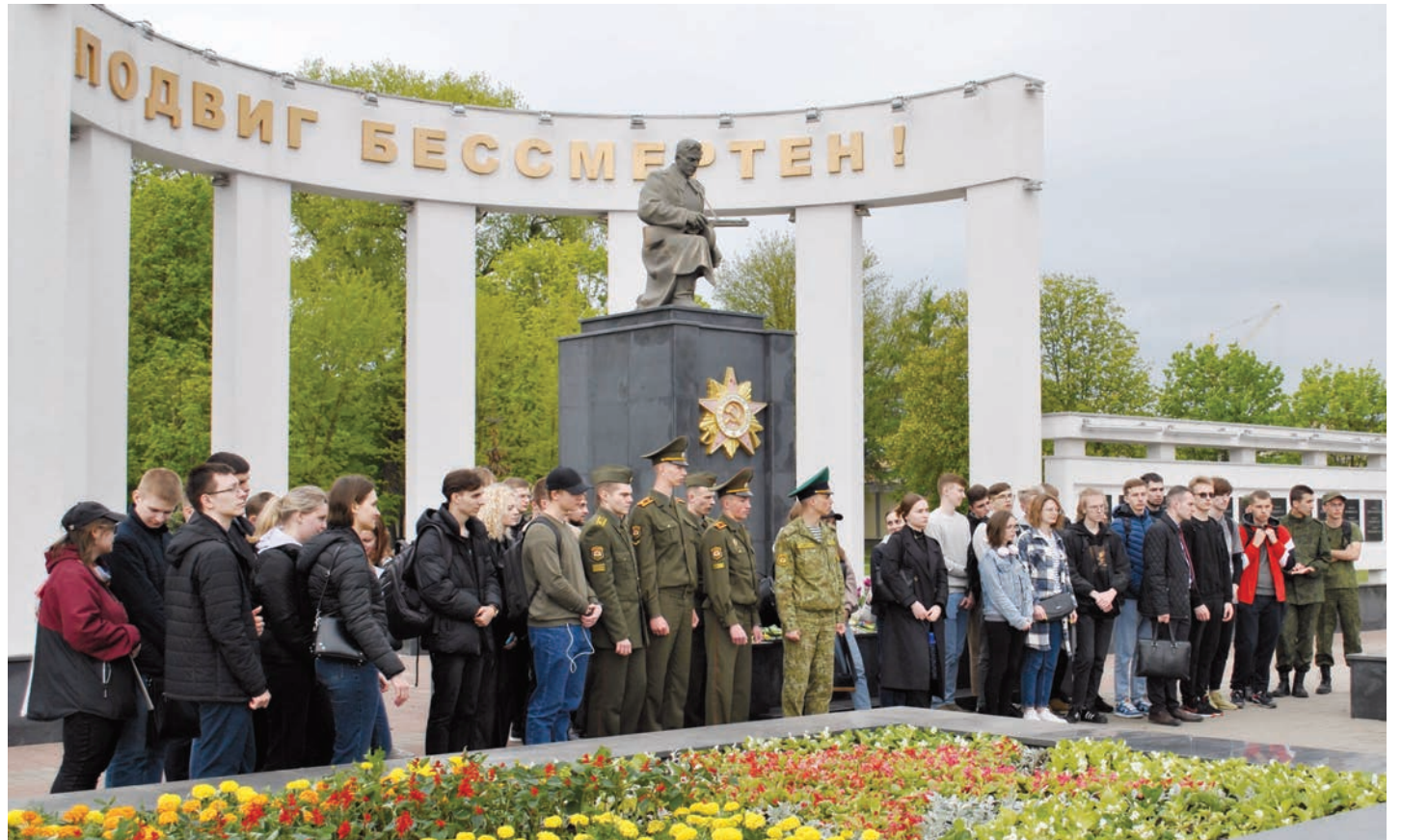
Кафедрой истории Беларуси ГГУ совместно с горкомом ОО «БРСМ» организован «Интерактивный квест по мемориалам Гомеля, посвященным истории Великой Отечественной войны»