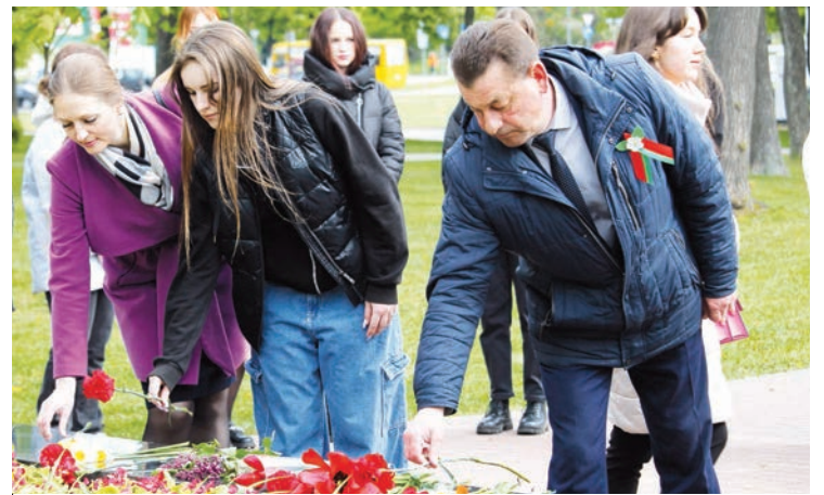
Накануне праздника представители ректората, общественных организаций, преподаватели и студенты почтили память воинов-освободителей и возложили цветы к братской могиле героев-подпольщиков и партизан