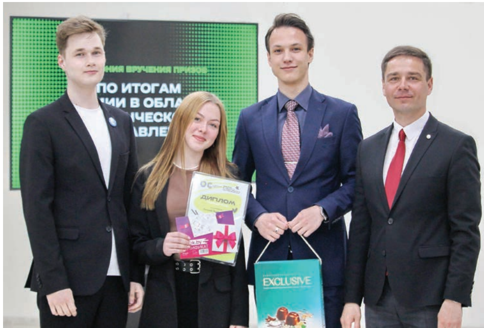
Награды получили лучшие

Лауреаты премии: «Лучший TikTok аккаунт» – студсовет юрфака, «Лучшее сообщество в ВКонтакте» – студсовет общештета № 2, «Лучший Instagram-аккаунт» – студсовет факультета истории и МК, «Лучший студенческий совет общештета» – студсовет общештета № 1, «Лучший студенческий совет факультета» – студсовет факультета истории и МК.