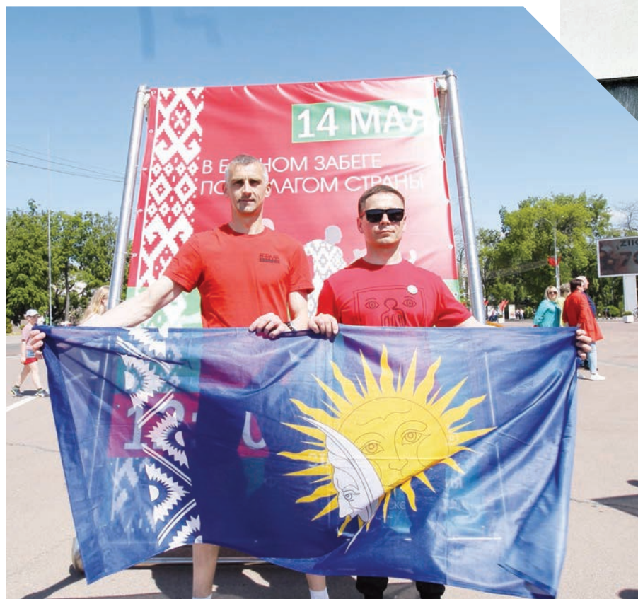
В массовом патриотическом забеге приняли участие около 50 человек из нашего вуза