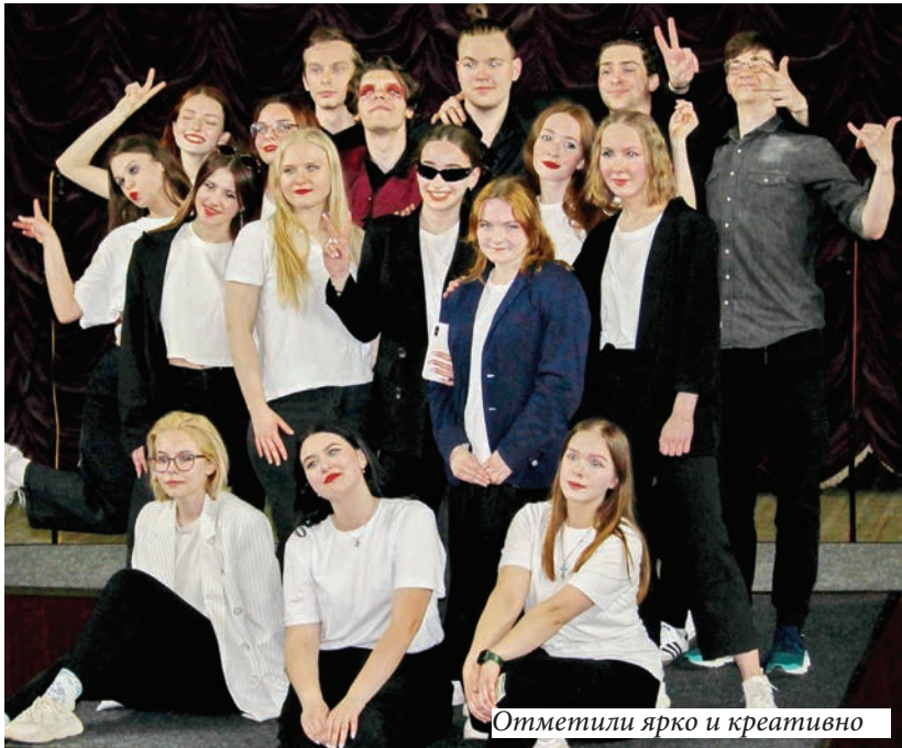
Отметили ярко и креативно