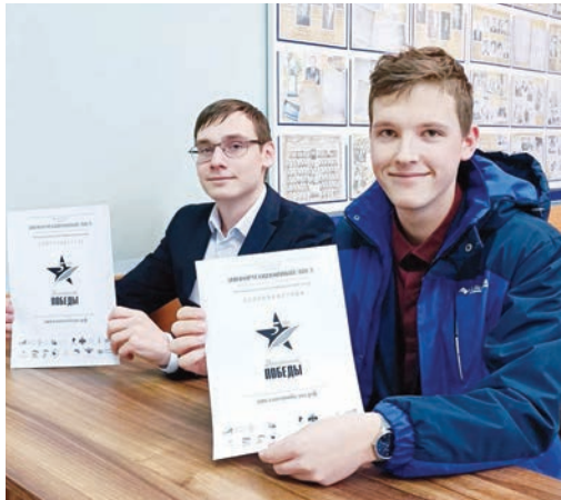
На факультете истории и межкультурных коммуникаций при поддержке Русского дома в Гомеле состоялся международный диктант на тему истории Великой Отечественной войны «Диктант Победы»