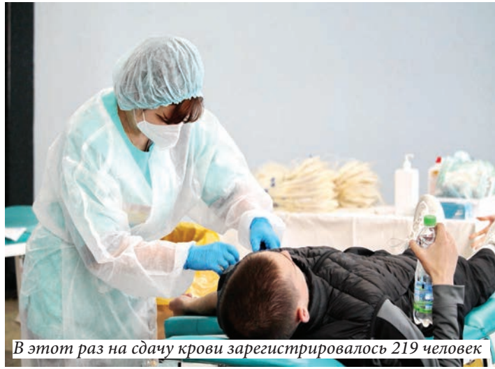
В этот раз на сдачу крови зарегистрировалось 219 человек