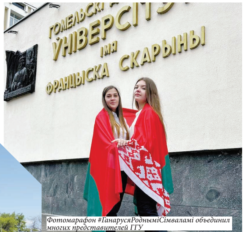
Фотомарафон #ГанарусяРодныміСімваламі объединил многих представителей ГГУ