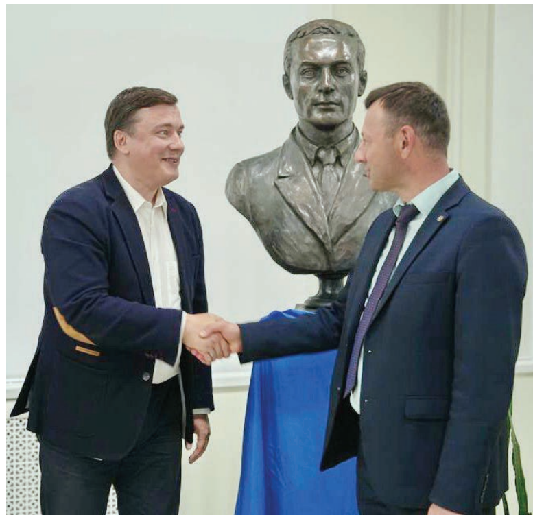
Бюст ученого займет почетное место на факультете психологии и педагогики университета