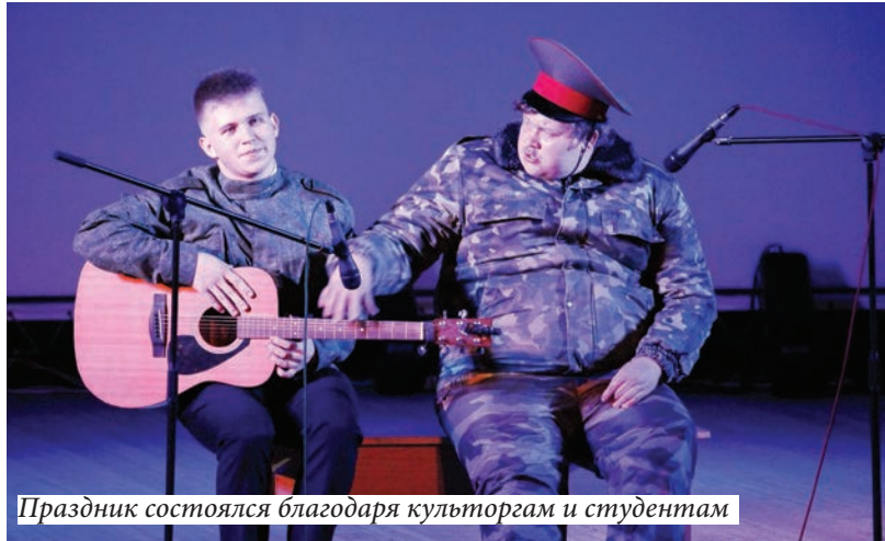
Праздник состоялся благодаря культоргам и студентам