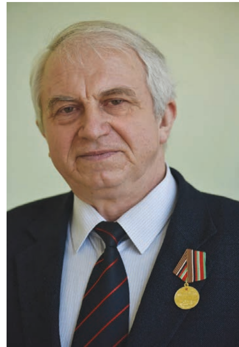
раммы. Возшло солнце, воздух нагрелся и стал "плавать", точная прицельная стрельба стала затруднительной, тем более что

Приходилось действовать по-разному: либо против душманов разворачивались целые операции с задействованием авиации, либо мы использовали противоречия между самими бандами (главари группировок далеко не всегда ладили между собой, соперничали за право контролировать территории).