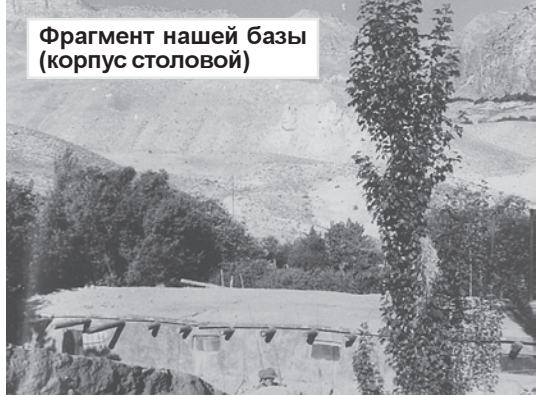
Фрагмент нашей базы (корпус столовой)

жилища, но и следы животных на песке. Мне до этого не приходилось видеть пустыню сверху. Ее я видел один только раз по дороге из Ашхабада в узбекский приграничный город Термез. Это была пустыня Каракумы, которую пришлось пересечь на поезде. Тогда я намаялся сполна: вагон днем нагрелся до такой степени, что у меня из носа пошла кровь, которую удалось унять только горячим зеленым чаем, предложенным пожилым проводником-туркменом. Вглядываясь в ог-