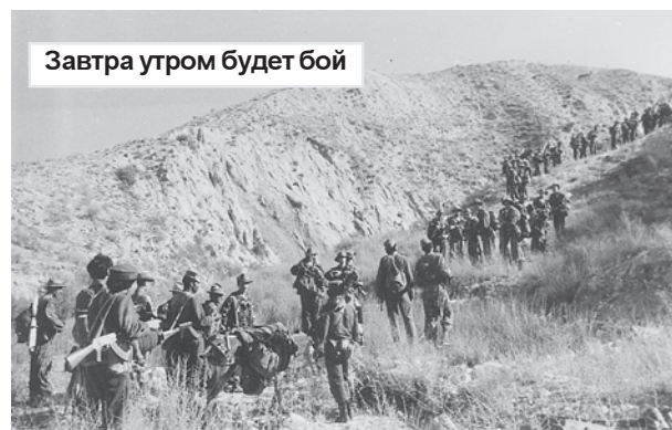
Завтра утром будет бой

Наступивший день принес мало радости, ибо с рассветом началась невообразимая стрельба. Стало ясно, что душманы, с которыми мы до-