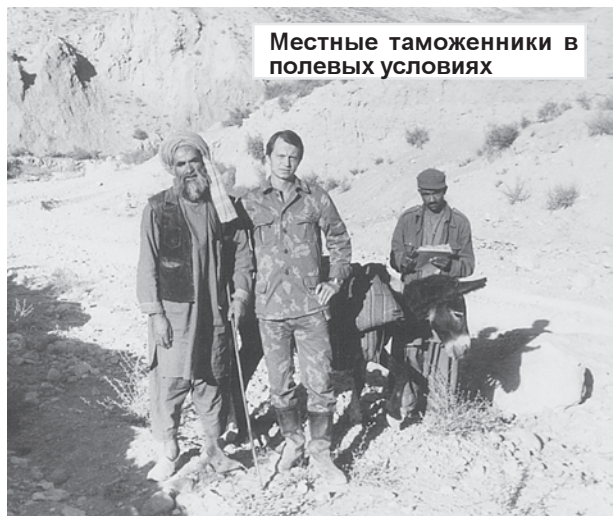
Местные таможенники в полевых условиях

...Вскоре горы наполнились рокотом моторов. Нужно было срочно обозначить себя сигнальной шашкой с оранжевым дымом. Счет шел на секунды, а мы, как назло, не могли найти сигнальные ракеты и зажечь их. Ситуация становилась крайне опасной, ведь летящие на большой скорости вертолеты запросто могли расстрелять нас самих, приняв за душма-