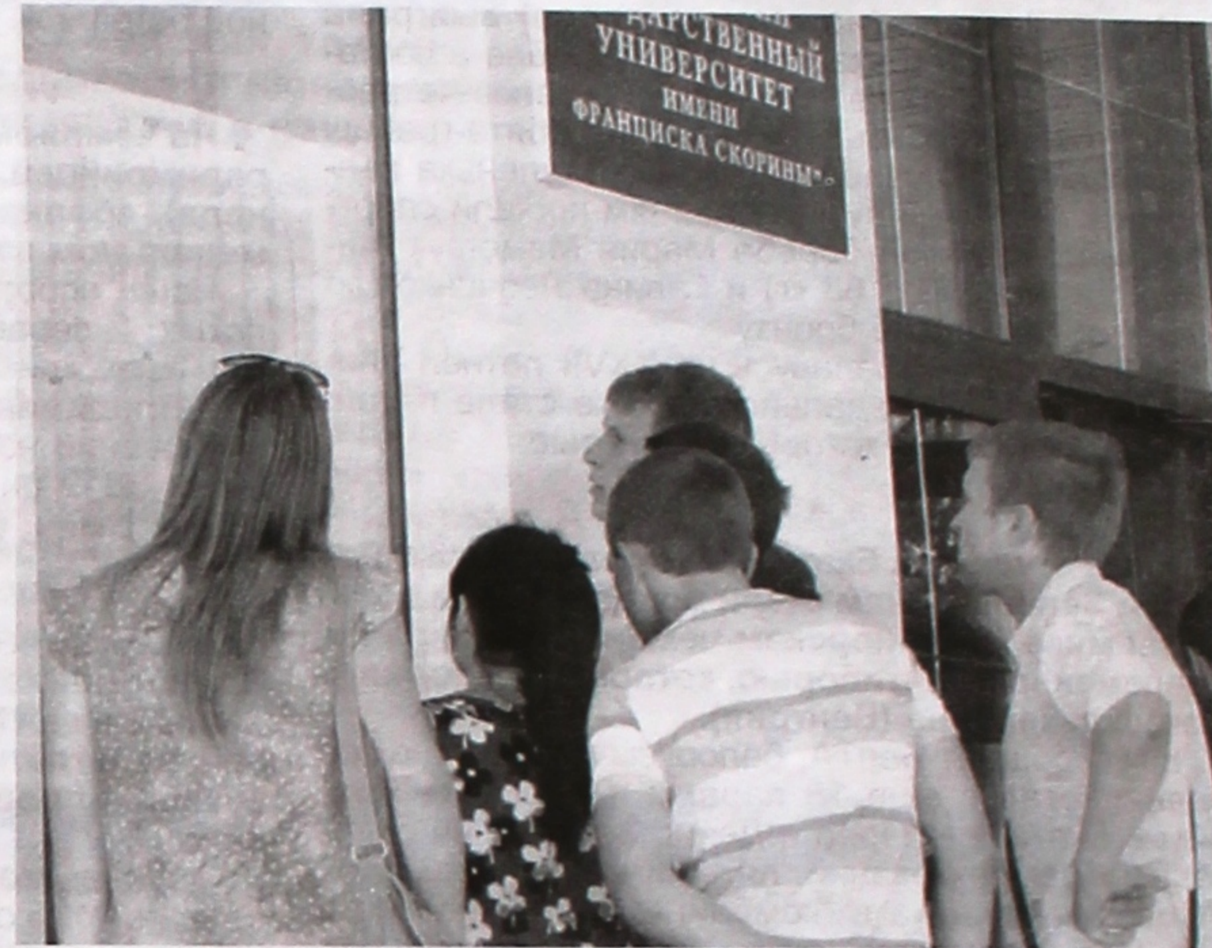
По данным приемной комиссии.