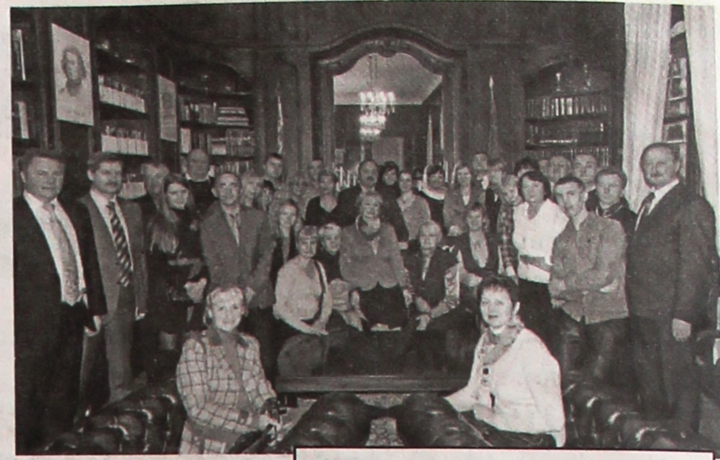
Делегация на приеме в Посольстве Республики Беларусь во Франции

разования Республики Беларусь, члены делегации познакомились с общеобразовательной системой этих стран. Рассказ об образовании в Германии был опубликован в нашей газете 10 января, сегодня вниманию читателей мы предлагаем очередную статью – о высшем образовании во Франции и возможностях его получения нашими соотечественниками.