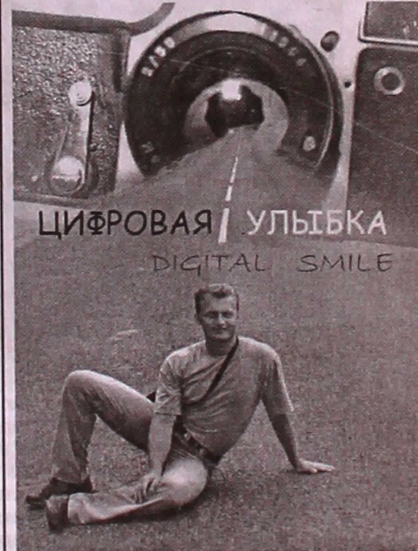
ЦИФРОВАЯ / УЛЫБКА DIGITAL SMILE