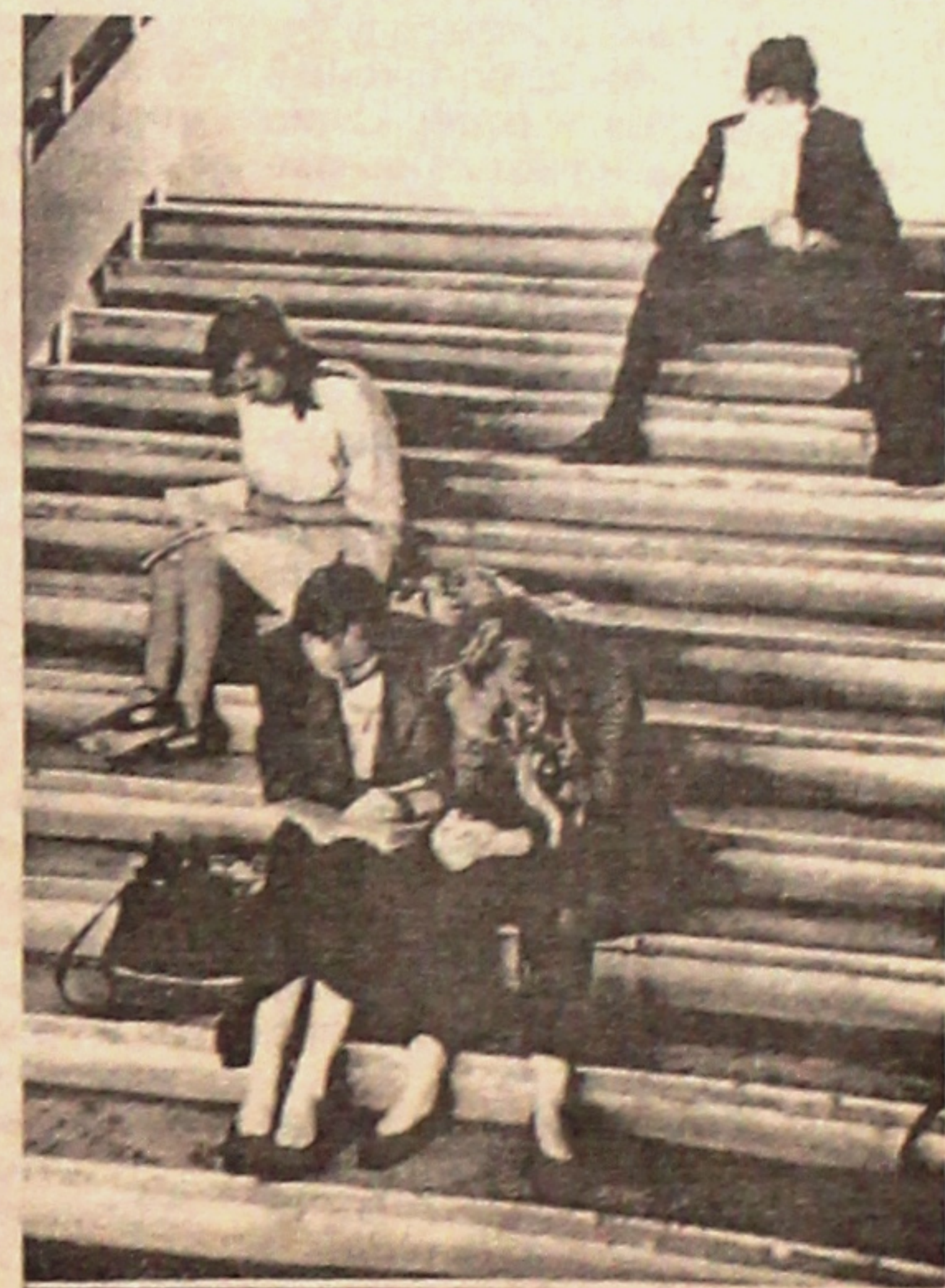
По ступенькам знаний – в вуз.

● На 11 факультетах дневного обучения в университете ведется подготовка около 5400 человек по 27 специальностям и 58 специализациям. Более 2500 человек получают высшее образование по 12 специальностям на заочном факультете. ● Особую потребность в выпускниках университета испытывает Гомельщина. Поэтому в значительной степени деятельность университета направлена на удовлетворение нужд региона в высококвалифицированных специалистах с высшим образованием, на внедрение научных разработок в областной народнохозяйственный комплекс. Причем спектр специальностей и специализаций, по которым ведется подготовка в университете, постоянно расширяется. Так, в 1998 году впервые проводился набор на специальности «Физическая электроника» и «Экология», в 1999 году – на специальность «Мировая экономика и международные экономические отношения» и педагогическое направление специальности «Прикладная математика», в 2000 году – на специальность «Белорусский язык и литература» со специализацией «Литературная работа в газетах и журналах», в 2003 году – на специальности «Лесное хозяйство» и «Программное обеспечение информационных технологий».