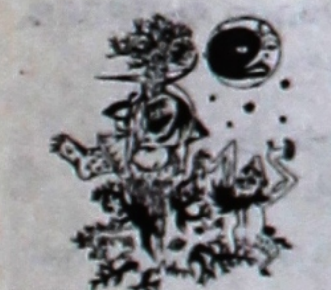
Черная линия 2002

последнюю точку. Последняя точка на бумаге означает начало жизни, новой легенды в этом мире.